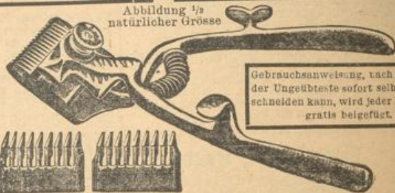
Abbildung 1/2 natürlicher Grösse

leichtere Ausführung nur 3.50 Mk. Diese Maschine kann per Doppelbrief versandt werden.