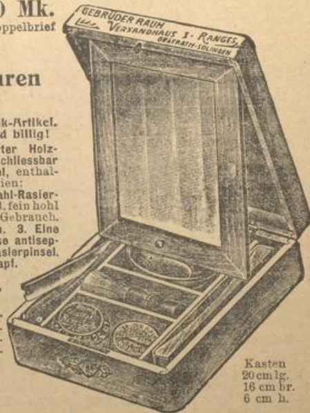
Kasten 20 cm lg. 16 cm br. 6 cm h.

Versand unter Nachnahme oder gegen Vorauszahlung des Betrages.