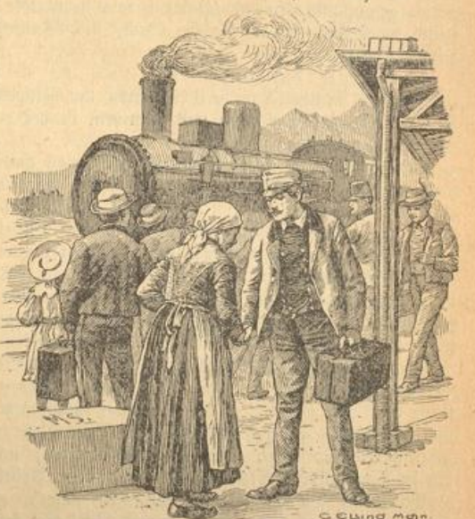
„Mutter, reicht wieder ein, damit sie mich heimlassen.“

„Wird er lange ausbleiben?“ „In längstens einer Stunde ist er daheim.“