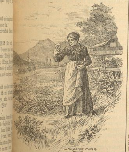
Herrgott in deinem Reich! das ist ja . . . ist ja echter, blanker Kalkstein."

Des Brechhäufelmannes einzige Tochter sitzt auf dem Gredbänkchen herausen, strickt an einem Sonn- tagsstrumpfe und schaut darüber weg sinnend zu Dale. Führt ein einsam und leutschen Leben, das sich nicht jedes in diesen Jahren führen wollte. Aber freilich: Heutzutage will das junge Gebursche ein über's andere aus mit lauter Getu' und Gewandhoffart, und wer da nicht mittun kann, dasselbe muß sich auch so hübsch einschichtig alten. Ist nicht so übel, das Dirndl, hat einen