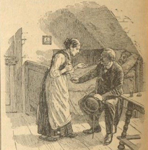
Wenn er, der Doktor, nur ein Wörtel hätte verlauten lassen, daß man die Pulver verstopfen sollte.

gibt . . . Daß Sie aber so wenig vorsichtig gewesen und so wenig achtsam auf das Schächtelchen? Ja, mein! Wer kann denn gleich an alles und gleich ans Aergste denken, wenn ihm der Kopf so voll Sorg und Kümmernissen steckt? Gar so arg ist er ja doch nicht beisammen gewesen, daß ihn eins hätte keinen Augenblick aus den Augen lassen dürfen. Den ganzen gestrigen Vormittag über ist er gewesen,