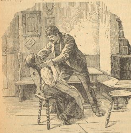
Seine Finger krampfen sich wie Klammern um ihren Hals.

Da kommt er wieder zu sich und zu gesundem Sinnen, und der Schreck ob der begangenen Tat scheucht seine Aufregung und seine Wut hinweg. Er läßt sie aus, und sie sinkt vom Stuhle auf die Erde nieder. „Mutter! Mutter!“ schreit er vor heller Angst, bückt sich nieder zu ihr und rüttelt sie durcheinander,