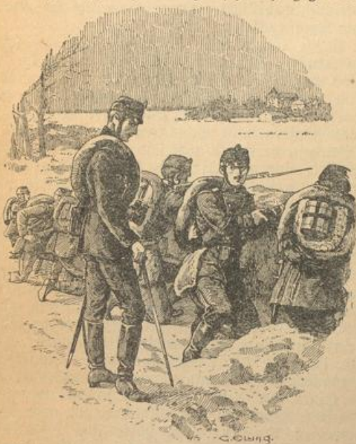
Mit freundlichem Blick sah der Einjährige zu dem Fähnrich auf.

Da kam er aber schön an in jeder Beziehung. Es ist wahr, das Korps der Württemberger war hier schwach, viel zu schwach gegenüber