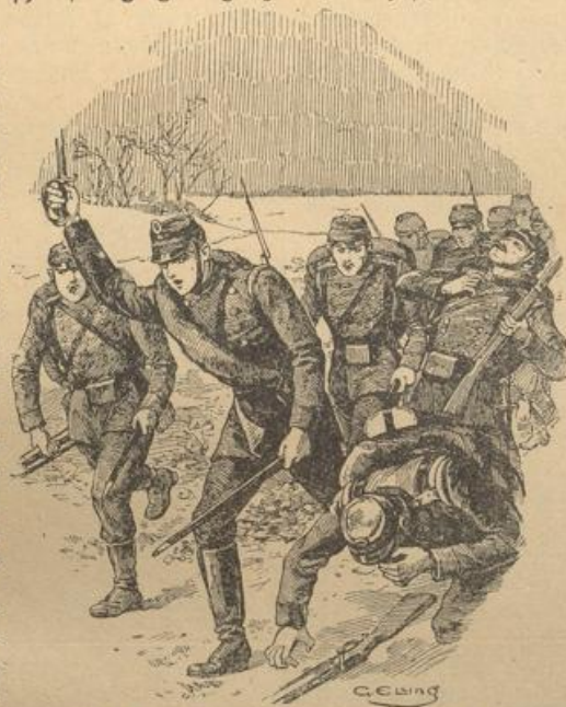
Und im Sturm geht es jetzt vorwärts: „Hurra, hurra!“

Der Hauptmann sah den Feldwebel verwundert an.