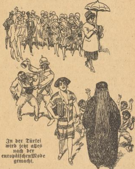
In der Türkei wird jetzt alles nach der europäischen Mode gemacht.

tragen werden! Eine ziemlich unverhüllte Kriegsdrohung. Freilich hat er hernach die schärftsten Neußerungen wieder zurückgemildert — aber etwas Unheimliches liegt doch in diesem Schrei des leidenschaftlichen Mannes. Daß er in seinem eigenen Volk auch allherhand Gegner hat, zeigen