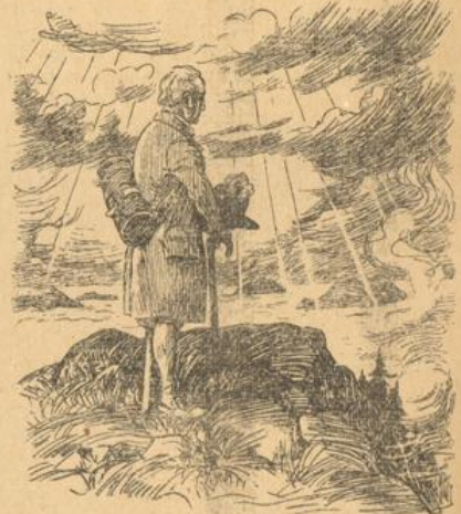
Mitten aus dem Nebelgewoge hat sich ein leuchtender Berggipfel gezeigt.

tet, als er den vorjährigen Kalender schrieb: das war die Hoffnung auf eine Verständigung Deutschlands mit seinen Gegnern, vor allem mit Frankreich. Was der Hintende schon im Vorjahr gesagt hat, das bekennt er auch dies Jahr: die beiden Nachbarn, Deutschland und Frankreich, müssen einmal den Weg zur Versöhnung finden. Sie sind ja aufeinander angewiesen. Wenn man Seite an Seite steht, darf man sich nicht ewig mit den Schultern stoßen und an den Armen packen und einander zuschreien: „Geh weg, du! Ich will an deinen Platz.“ Oder, wie die Franzosen sagen: „Otez-toi, que je m'y mette!“ Sonst gibt es nur eine ewige Kackballe mit blutigen Köpfen, zerbrochenen Rippen und einem verzweifelt Herzen. Und heraus kommt dabei: nichts! Gar nichts, als Tränen, Blut, zerstörte Städte, verwüstetes Land. Die beiden Völker sind von unserem Herrgott mit besonderen Gaben gesegnet. Das französische Volk mit einer geistigen Beweglichkeit, mit einer Liebenswürdigkeit und Anmut, mit einer Lebendigkeit des Schaffens, das es viele Jahrzehnte lang zum Liebling von Europa gemacht hat. Der Hintende erinnert sich noch der Zeit, in der Paris die Hauptstadt der Welt genannt worden ist, weil alle Hochgebildeten, alle Künstler, alle Freunde eines feinen Lebensgeschmacks dort ihre Schule durchgemacht haben. Und unser deutsches Volk mit seiner tiefen Geistigkeit, mit seiner Zähigkeit und Beharrlichkeit in der Arbeit, mit der Gabe des philosophischen