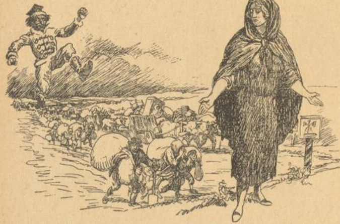
Die armen Optanten sind von dem polnischen Reiterstiesel über die Grenze gestofen worden.

Die englischen Arbeiter haben sich damit nicht zufrieden geben wollen. Sie sind eine gewisse noble Lebenshaltung gewohnt, und von der wollten sie nicht lassen. Als dann die Regierung erklärte, vom 1. Mai ab werden keine Zuschüsse mehr bezahlt, und als die Bergherren daraus den Schluß zogen: Also wird vom 1. Mai ab weniger bezahlt und mehr gearbeitet, haben die englischen