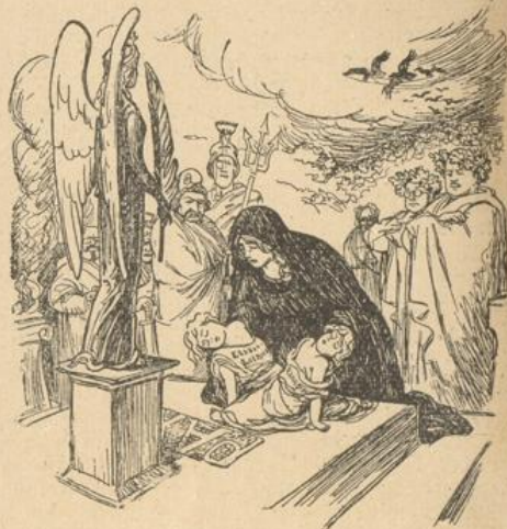
Deutschland hat auf dem Altar des Weltfriedens zwei lieb. Kinder als Opfer niedergelegt.

ohne daß sie selbst irgendein nennenswertes Opfer dagegen gebracht haben. Wird dies große Opfer, das Deutschland gebracht hat, wirklich von Weltfriedens verbürgen, wenigstens für die kommenden Jahrzehnte — nun, dann ist es nicht umsonst gebracht! So schwer es auch ist! Aber die Franzosen pflegen zu sagen: „Qui vivra, verra!“ „Man wird sehen!“ Wenn nur die Fortsetzung des Sprüchleins nicht zur Wahrheit wird: „Man wird