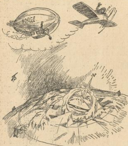
Der Nordpol hat über die sonderbaren Vögel über seinem Haupt ein spöttisches Gesicht gemacht.

vergnüglih in den Straßen herum wie die Europäerinnen. Und wenn in der Türkei heutzutage ein Mädchenpensionat spazieren geht, werden die jungen Gymnasiasten und Studenten den jungen Mädchen ihre Kufhände zuwerfen können wie in Karlsruhe oder in Darmstadt oder in Stuttgart. Man spricht sogar davon, daß die alte mohammedanische Zeitrechnung abgeschafft wer-