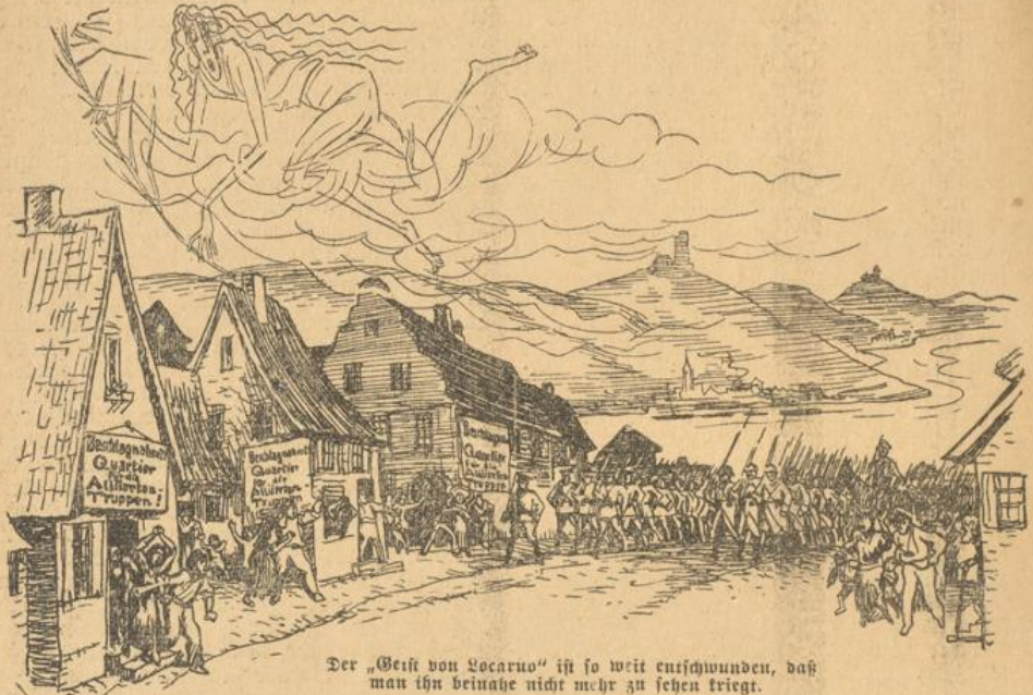
Der „Geist von Locarno“ ist so weit entwichen, daß man ihn beinahe nicht mehr zu sehen kriegt.

Die Sache ging so zu: England und Frankreich war es nicht so ganz wohl bei dem Gedanken, daß Deutschland im Völkerbundsrat ein sehr bedeutendes Gewicht erhalten könne. Denn auch die beiden „Freunde aus dem Weltkrieg“ trauen einander nicht über den Weg. Wenn etwa Deutschland mit England und Japan zusammen „Rippes machte“? O weh, Frankreich! Oder