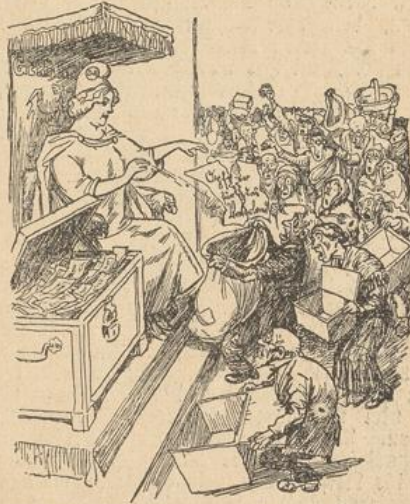
Alte und Verhungerte sind von der Mutter Germania mit einem Bettelpfennig „begast“ worden.

kappe vom Kopf gerissen und geschrien: „Fort mit der ganzen Bescherung!“ Man hat die Sache vor den Reichstag gebracht und verlangt, daß nicht die gerichtlichen Prozesse, sondern ein Reichs- gesetz die ganze Angelegenheit schlichten solle. Wäre es doch dabei geblieben! Aber die Parteien sind sich wieder so in die Haare gekommen wegen dieses Gesetzes, daß die Sozialdemokraten und die Kommunisten ein „Volksbegehren“ verlangt haben. Das ganze deutsche Volk sollte befragt werden,