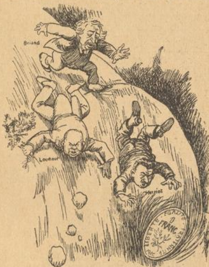
Ein Minister um den andern ist den fallenden Franken in den Abgrund nachgestürzt.

In Oesterreich ist ein kleiner Fortschritt ermöglicht worden. Das Land hat eine neue Währung eingeführt, den Schilling, der ungefähr 60 Pfennige wert ist. Seither ist sein Geld nicht mehr im Wert gefallen. Und es wird wohl so wie wir in Deutschland sagen können, daß die Valuta für die Zukunft ihm keine Sorgen mehr zu bereiten braucht. Darum hat der Völkerbundsrat auf Antrag Oesterreichs beschlossen, auf den 1. Januar die Finanzkontrolle aufzuheben, die über dem unglücklichen kleinen Land bisher gelegen war. Die Einnahmen und Ausgaben wurden von einem Beauftragten des Völkerbunds