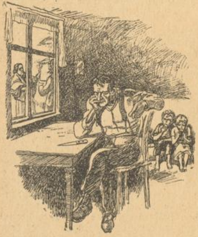
Reisige Männer haben gezwungenermaßen faulenzgen müssen.

Am 20. Juni hat nun das deutsche Volk das Wort gehabt, ob es das sozialistisch-kommunistische Gesetz annehmen wolle oder nicht. Es ist ungeheuer geschäftet worden in Deutschland, von den Anhängern des Gesetzes und von den Gegnern. Schließlich ist es doch nicht durchgegangen. Etwa 19 Millionen Stimmen hätten dafür abgegeben werden müssen. Aber es haben nur etwa 14½ Millionen „Ja“ gesagt. Das ist doch eine sehr große Zahl, und man hat sehen müssen, daß in Deutschland Zahllose voll Mut und Groll waren über die unvernünftigen Forderungen, die manche Fürsten gestellt haben. Nun muß der Reichstag das Gesetz über die Fürstenabfindung machen. Das wird nicht leicht sein. Auf der einen Seite stehen die Rechtsparteien, die den Fürsten möglichst viel von ihrem früheren Besitz zuwenden möchten. Auf der anderen Seite verlangen die Linksparteien, daß der Volksstimmung vom 20. Juni ihr Recht werde. Jetzt — wie soll das Gesetz aussehen, daß es die Mehrheit kriegt? Die