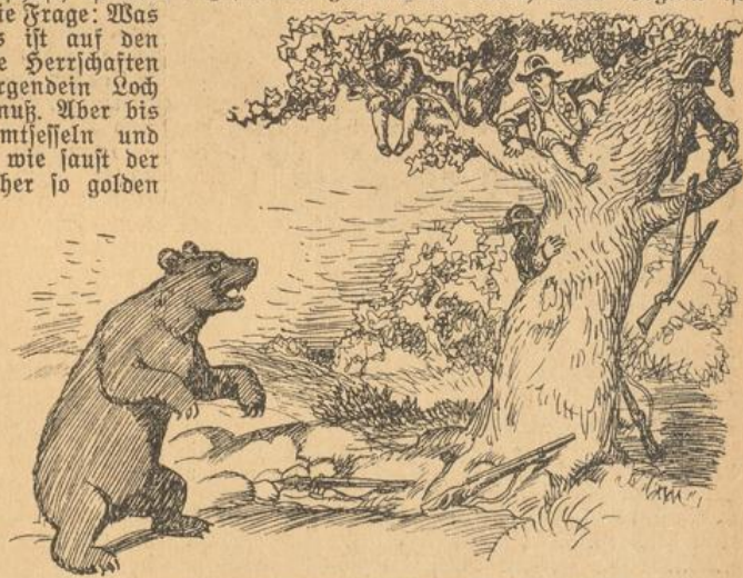
Deutsche Diplomaten haben das Fell des Bären verkauft, ehe sie ihn erlegt hatten.

Entweder ihr zahlt — oder ihr rüstet ab!“ Da sagten sich die Staatsmänner von Frankreich und England: „Hilft nichts, man muß wenigstens dergleichen tun, als ob es uns Ernst wäre mit der Abrüstung!“ „Soll der Vertrag von Locarno nicht eine Frage sein, so muß die Militärmacht jedes Staates eingeschränkt werden“ — das hat sogar der englische Exminister Lloyd George gesagt. Aber die Staatsmänner denken — und die Generale lenken. Und die französischen Generale erzählen immer wieder aufs neue dem schauernden französischen Volk Schredensmärchen von dem bösen Deutschland, das insgeheim ungeheure Kriegsrüstungen vorbereite. Einer von diesen Generalen hat sogar in der Kammer zu Paris behauptet, im Schwarzwald würden militärische Manöver vorgenommen, und deutsche Marineoffiziere durchstreifen den Schwarzwald mit Karten in den Händen, auf denen die Pläne für die Eisenbahnzüge eingetragen seien für die Truppentransporte zum nächsten Kriege. Es ist nichts so albern, daß es nicht Gläubige findet. Und der Minister Briand hat trotz aller Friedensschalmeien, die er bläht, doch das Wort gesagt: Frankreich dürfe nicht vergessen, daß Deutschland 60 Millionen zähle, während Frankreich nur 40 Millionen Einwohner habe. Da sieht es mit der Abrüstung windig aus. Man ist im Monat Mai in Genf zusammengekommen, um darüber zu beraten. Von Deutschland ist Graf Bernstorff als Abgesandter gekommen. Gleich beim Beginn ist