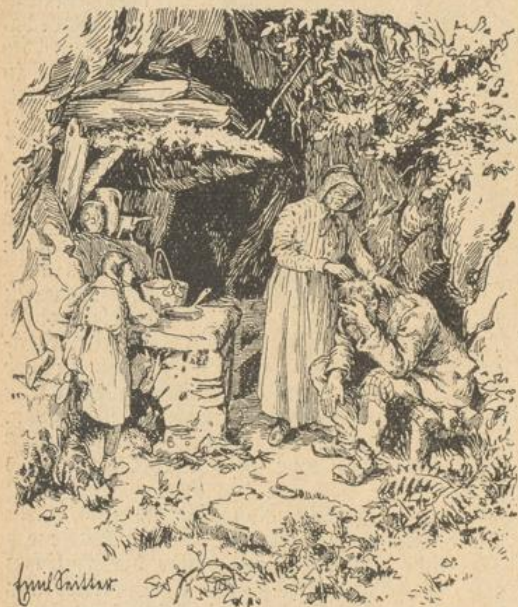
„Toni,“ sagte sie stockend, „sell Lache, des gib i zu, sell ick unrecht vo mer gsi.“

„Edelsteine? Gold?“ fragte ich plötzlich stürmisch, hüpfte auf den Wurzelmann zu: „Haha!“ lachte ich, „bist du am End der Köhlertoni von Amerika, mit dem Hutvoll Gold? Und die Köpfer? He? Schustersrappen!“