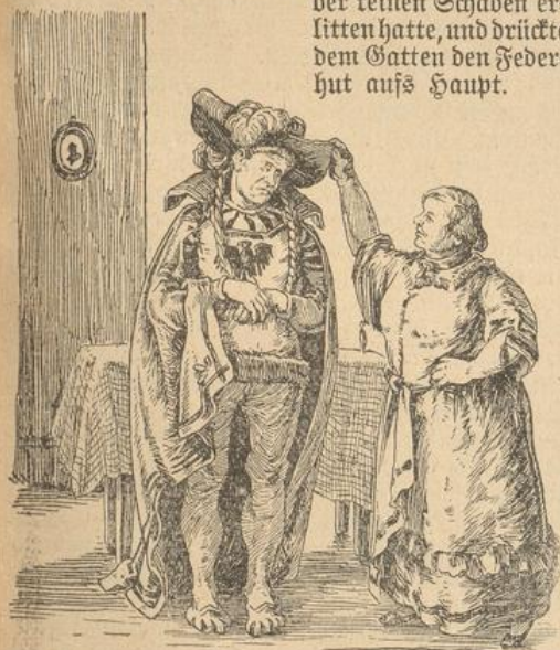
Seine Frau strich den Adler glatt und drückte dem Gatten den Federhut aufs Haupt.

der keinen Schaden erlitten hatte, und drückte dem Gatten den Federhut aufs Haupt.