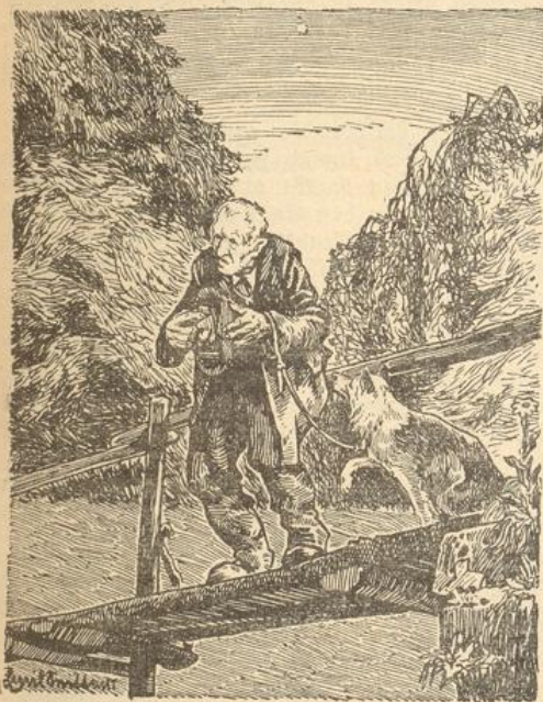
Benjam steht auf der Brücke und starrt ins Wasser.

Ein einfacher, bescheidener Mann war das. Wie gar einfach er wirklich war, das kann noch jetzt jedermann deutlich an dem Hause sehen, das er einst bewohnt hat; denn die Amerikaner haben dies Haus genau, wie es war, erhalten bis auf den heutigen Tag; nicht sowohl des Blitzableiters