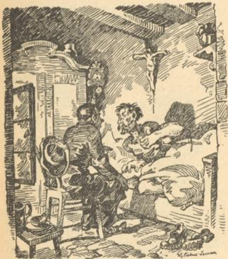
Der Venturi rechte sich jäh auf, die Augen gleichten ihm.

den Bützer verirrt in der wilden Fremde, müd und zerschlagen auf einer Felsenacke droben sitzen, davon er nimmer herunter konnte. Und über die Donau mußte er ja auch, und die war abscheulich tief, und wer weiß, ob die Brücke gut instand ist, darüber er wallfahrtet, und ob nicht gerade ein morsches Brett unter ihm bricht und er gottsklänglich ertrinken muß im