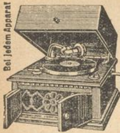
Bei jedem Apparat