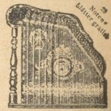
Umtausch oder Geld zurück, daher kein Risiko!

Vor anderweitigem Kauf verlange man den neuesten Katalog über sämtliche Musikinstrumente von Robert Husberg Gegr. 1897 Neuenrade i. W. K 14