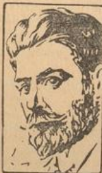
Prof. R. Roxroy

KOSTENFREI wird Ihnen Ihr Horoskop nach den Gestirnen von diesem großen Astrologen sofort zugestellt werden, dessen Voraussagungen die angesehensten Leute beider Erdteile in das größte Erstaunen versetzt haben. Sie brauchen nur Ihren Namen und Ihre Adresse deutlich und eigenhändig geschrieben einzusenden und gleichzeitig anzugeben, ob Mann oder Frau (verheirat. od. ledig) oder Ihren Titel, nebst dem richtigen Tag Ihrer Geburt. Sie brauchen kein Geld einzusenden, aber wenn Sie wünschen, können Sie 25 Pfg. in Briefmarken (keine Geldmünzen einschließen) zur Deckung des Briefportos und der unerlässlichen Kontorarbeit beilegen. Sie werden über die außerordentliche Genauigkeit seiner Voraussagungen Ihres Lebenslaufes sehr erstaunt sein. Zögern Sie nicht, schreiben Sie sofort, und adressieren Sie Ihren Brief an ROXROY STUDIOS , Dept. Kal. 90, Emmastraat 42, Den Haag, Holland. Das Briefporto nach Holland beträgt 25 Pf.