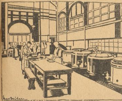
Eine Küche im Übersesheim der Sapas in Hamburg

Das sind also nur einige kleine Gruppen. Die weitaus größte Zahl derer, die sich für dauernd in den Vereinigten Staaten niederlassen wollen, fällt unter die Quote. Von den Quoteneinwanderern werden jedoch, und das ist wichtig, verschiedene bevorzugt behandelt. Wer zu diesen gehört, braucht nicht wie alle anderen zwei Jahre und länger zu warten, bis er sein Visum erhält, sondern kann wohl damit rechnen, daß er es bereits etwa acht Wochen nach Stellung des Antrages bekommt. Als bevorzugt gelten: Die Eltern eines voll-