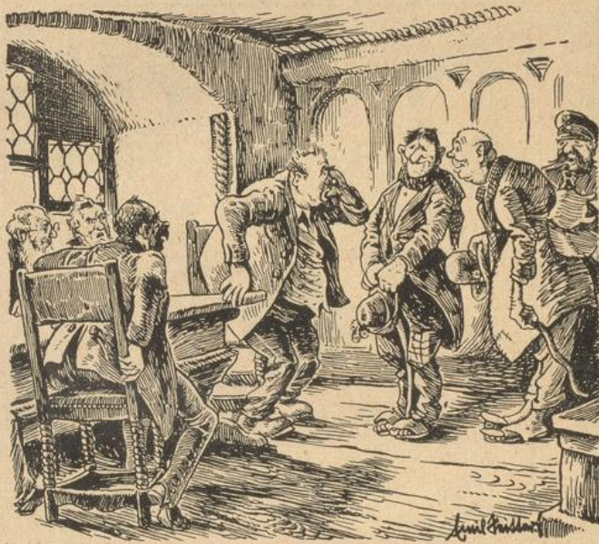
Der Hannes als Sprecher nahm das Wort.

Wieder einmal war Gemeinderatsitzung, und zwar die wichtige Budgetsitzung in Dielheim. Der Bürgermeister hielt gerade seinen Vortrag über das Armenwesen — „und so ist, nachdem ein Teil der Armen mit Unterstützung der Gemeinde nach Amerika ausgewandert ist, für die Armentasse eine Erleichterung eingetreten —“ hieron knüpfte sich ein kleiner Schwatz. „Wie es wohl dem Hannes und dem Peter drüben gehen mag?“ meinte einer.