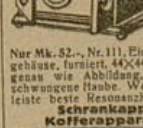
Nur Mk. 52.-, Nr. 111, Eichen-gehäuse, furniert, 44x44x33, genau wie Abbildung, ge-schwungene Haube, Wellen-leiste beste Resonanzhaube