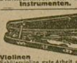
Violen Schillervioline, gute Arbeit, goldbraun lackiert, Mk. 5.50. Komplette Violinen mit Formel, Bogen, Koloophon u. Stimmplatte von Mk. 11.50 an