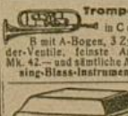
Trompete in C oder B mit A-Bogen, 3 Zylinder-Ventile, feinste Arbeit Mk. 42.- und sämtliche Messing-Blas-Instrumente