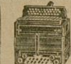
Bozener-Harmonikas mit Melikonbässen, Stahlstimmen, 21 Tasten, 8 Bässe Mk. 60.-