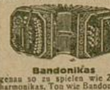
Bandonikas genau so zu spielen wie Ziehharmonikas, Ton wie Bandonions 21 Tasten, 8 Bässe, Stahlstimmen Mk. 27.50