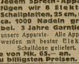
Jedem Sprech-Apparat fügen wir 8 Elektro-Schallplatten, 25 cm, und ca. 1000 Melodien gratis bei. 3 Jahre Garantie für unsere Apparate. Alle Apparate werden mit bester Elektro-Schalldose geliefert.

Husberg & Comp., Neuenrade Nr. 2 (Westf.) Beste und billigste Bezugsquelle.