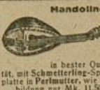
Mandolinen in bester Qualität, mit Schmetterling-Spielplatte in Perlmutt, wie Abbildung nur Mk. 11.50 Billigere und noch bessere, auch echt italienische, nach Katalog