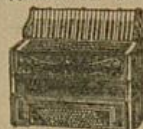
Piano-Harmonikas bis zu den feinsten Künstler-Instrumenten, 21 Tasten, 8 Bässe, Stahlstimmen Mk. 35.-