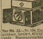
Nur Mk. 33.-, Nr. 104, Eichen-gehäuse, furniert, 42x42x31, runde Rotations-trommel, 25-cm-Plattenteller, Elektro-Schlaugentonarm u. Schall-dose, bestes Edelfederwerk