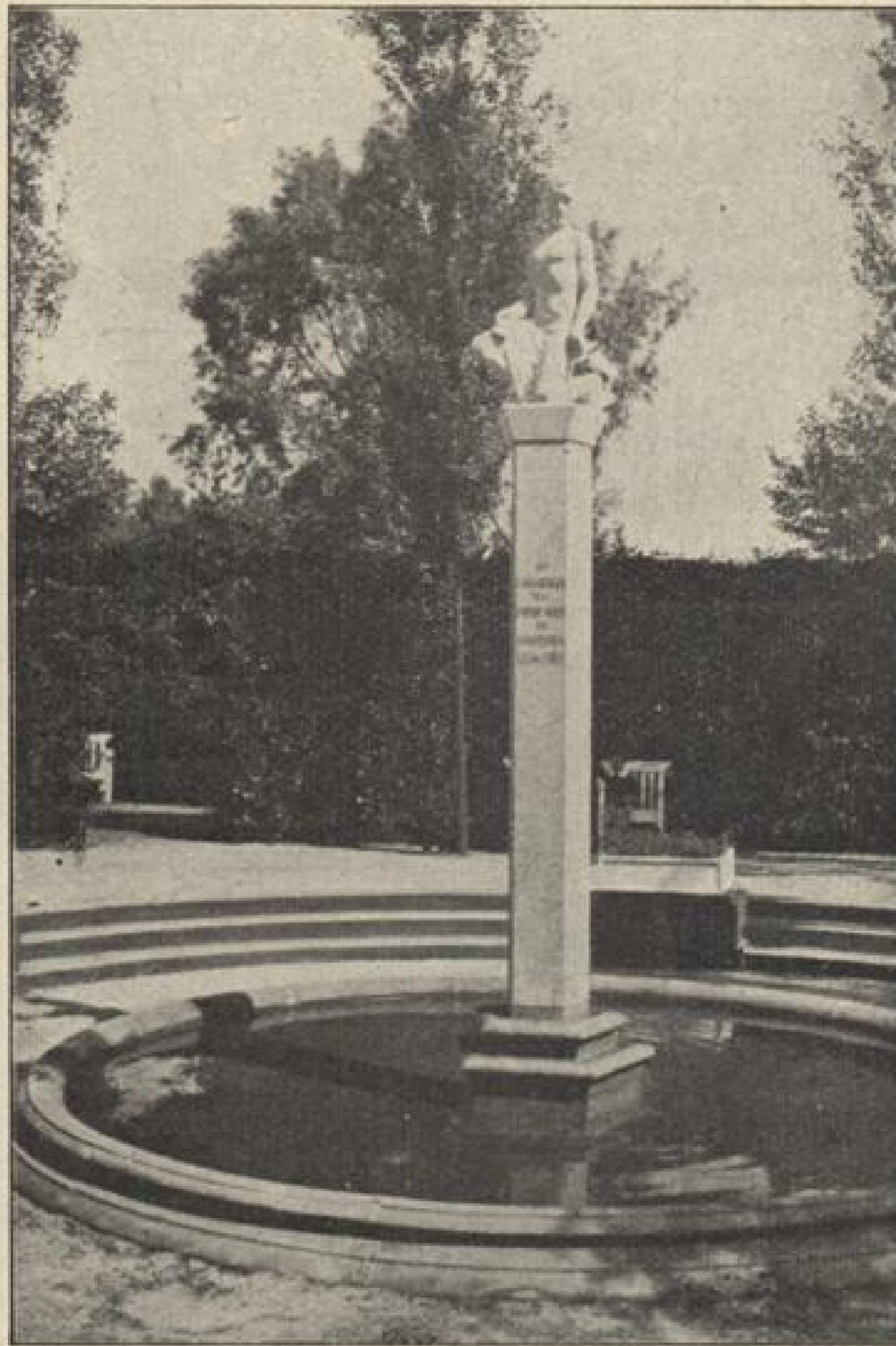
„Wolff-Anlage“: Denkmal im runden Garten.

Die ersten fünf preisbedachten Einsender der richtigen Lösung sind: