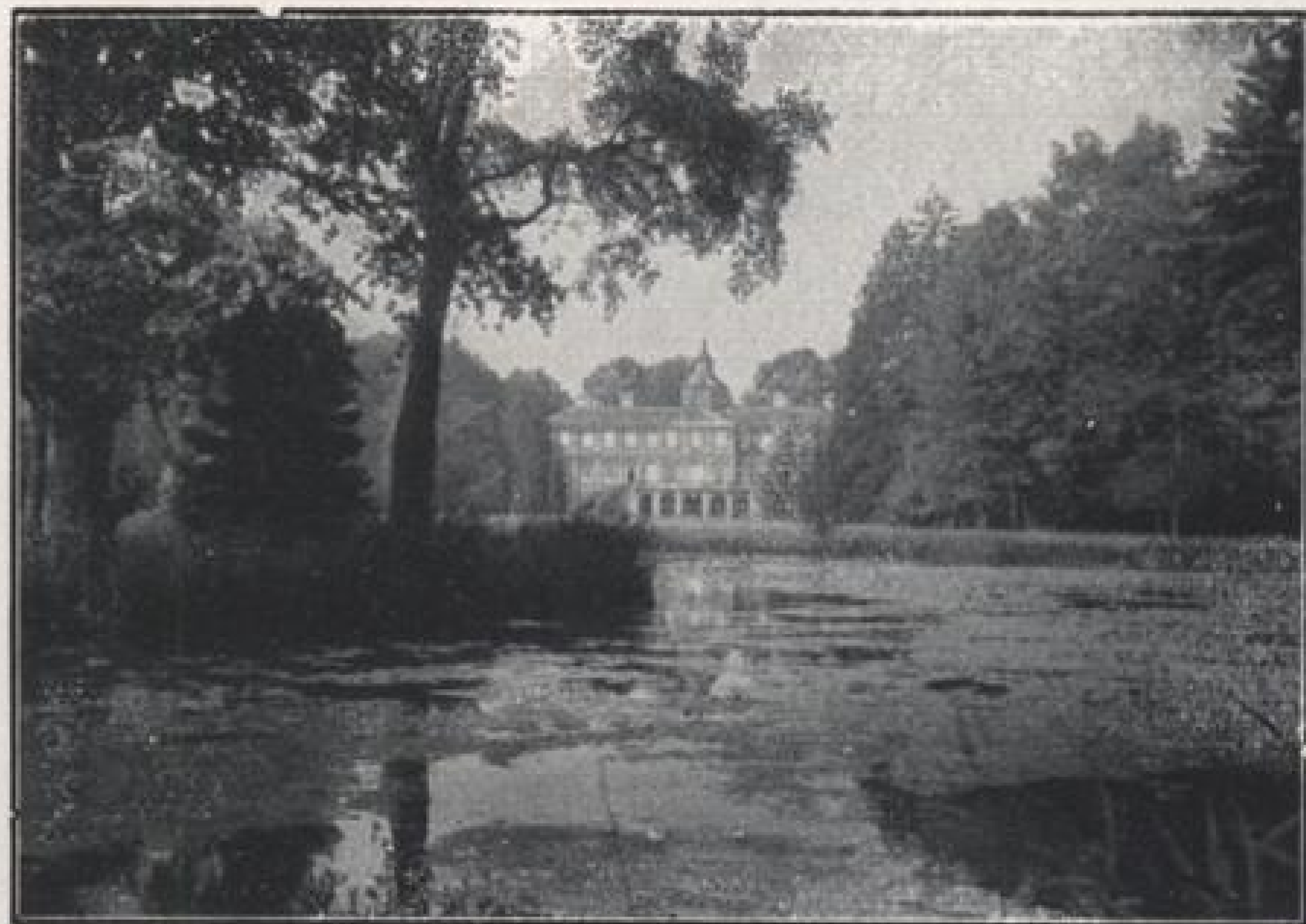
Schloß Favorite bei Rastatt.

Das herrliche Rastatter Schwimmstadion mit den neuzeitlichsten Einrichtungen, bietet Ihnen Erfrischung und Erholung in Licht, Luft und Sonne.