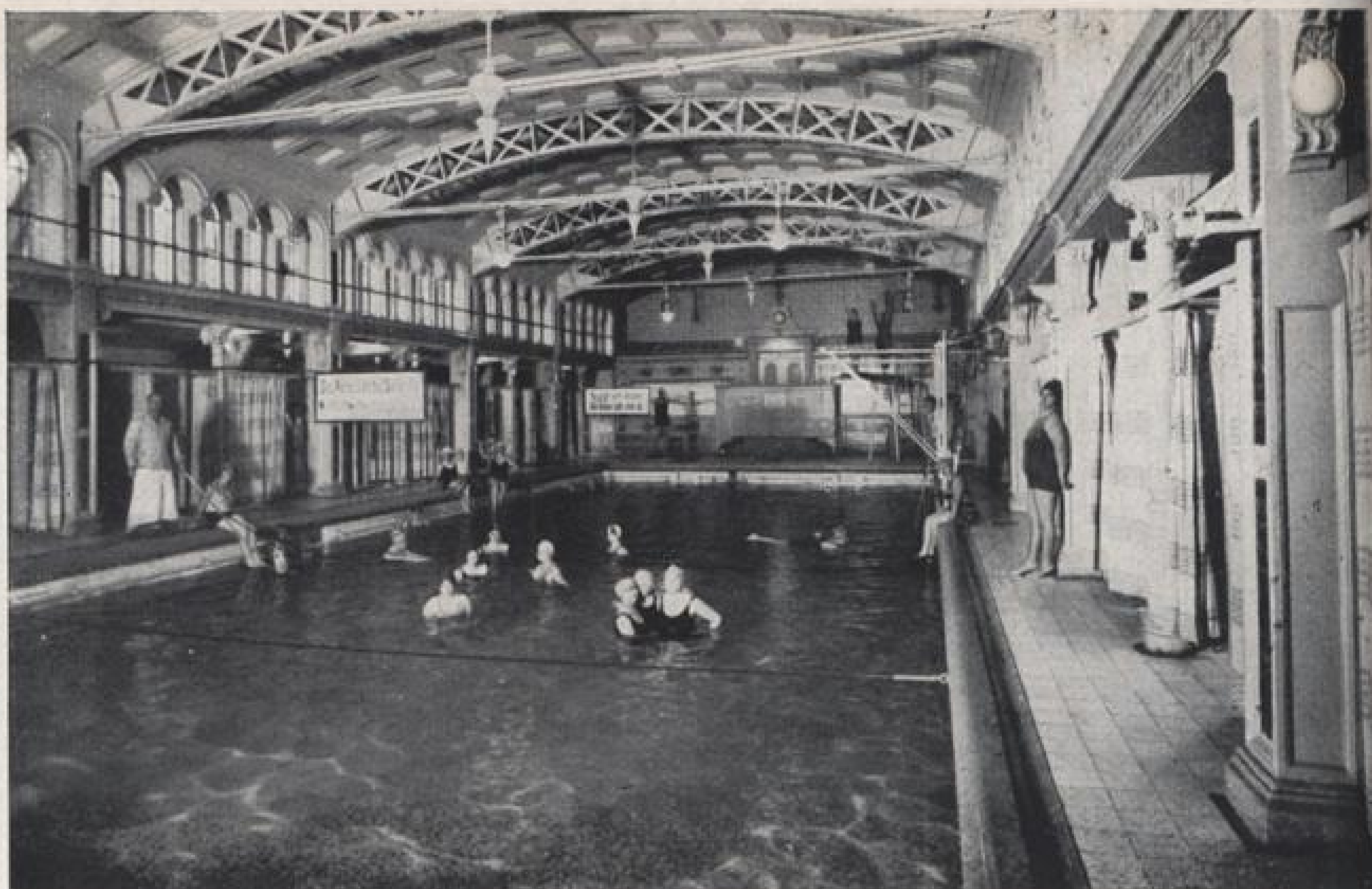
Schwimmhalle des Städt. Friedrichsbades.