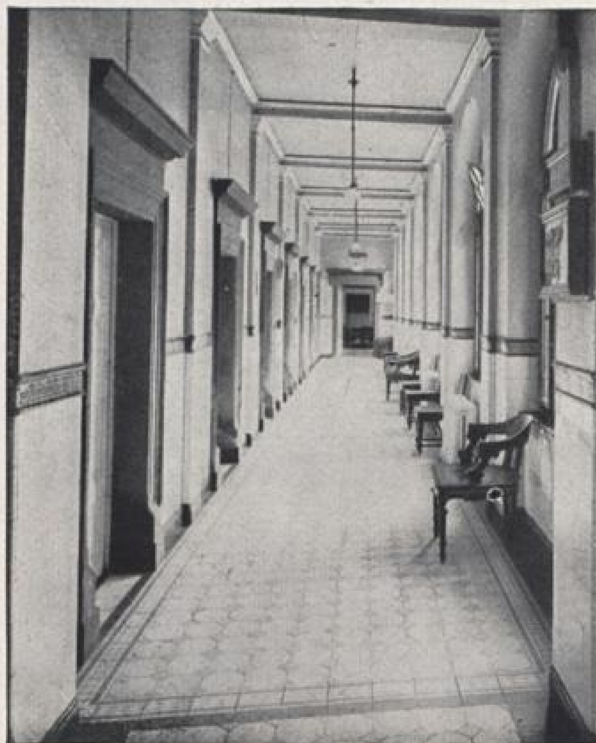
Die lange Flucht in der Wandelhalle der Wannens- u. medizinischen Abteilung im Vierordtbad.

Städt. Vierordtbad, Platz d. SA., Städt. Friedrichsbad, Kaiserstr. 136