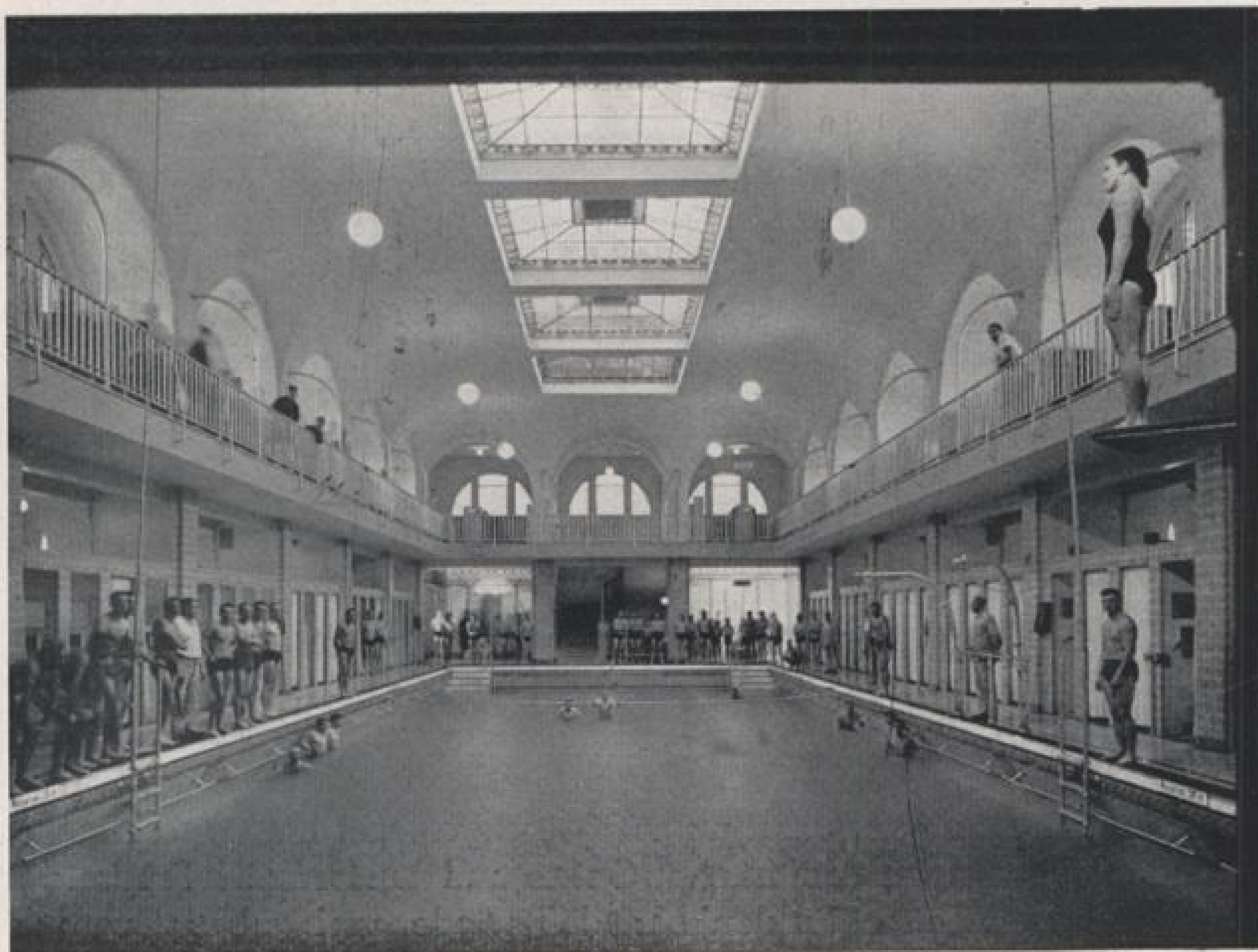
In der renovierten Schwimmhalle des Städt. Vierordtbades.

Hier werden die verschiedensten Kurbäder: Irisch-Römische Bäder, russische Dampfbäder, elektrische Lichtbäder, Dampfkastenbäder, Heißluftstrombäder, Schaumbäder, Wechselduschen, Sitz- und Fußbäder, Kneippgüsse, Halbbäder, Packungen, Massagen