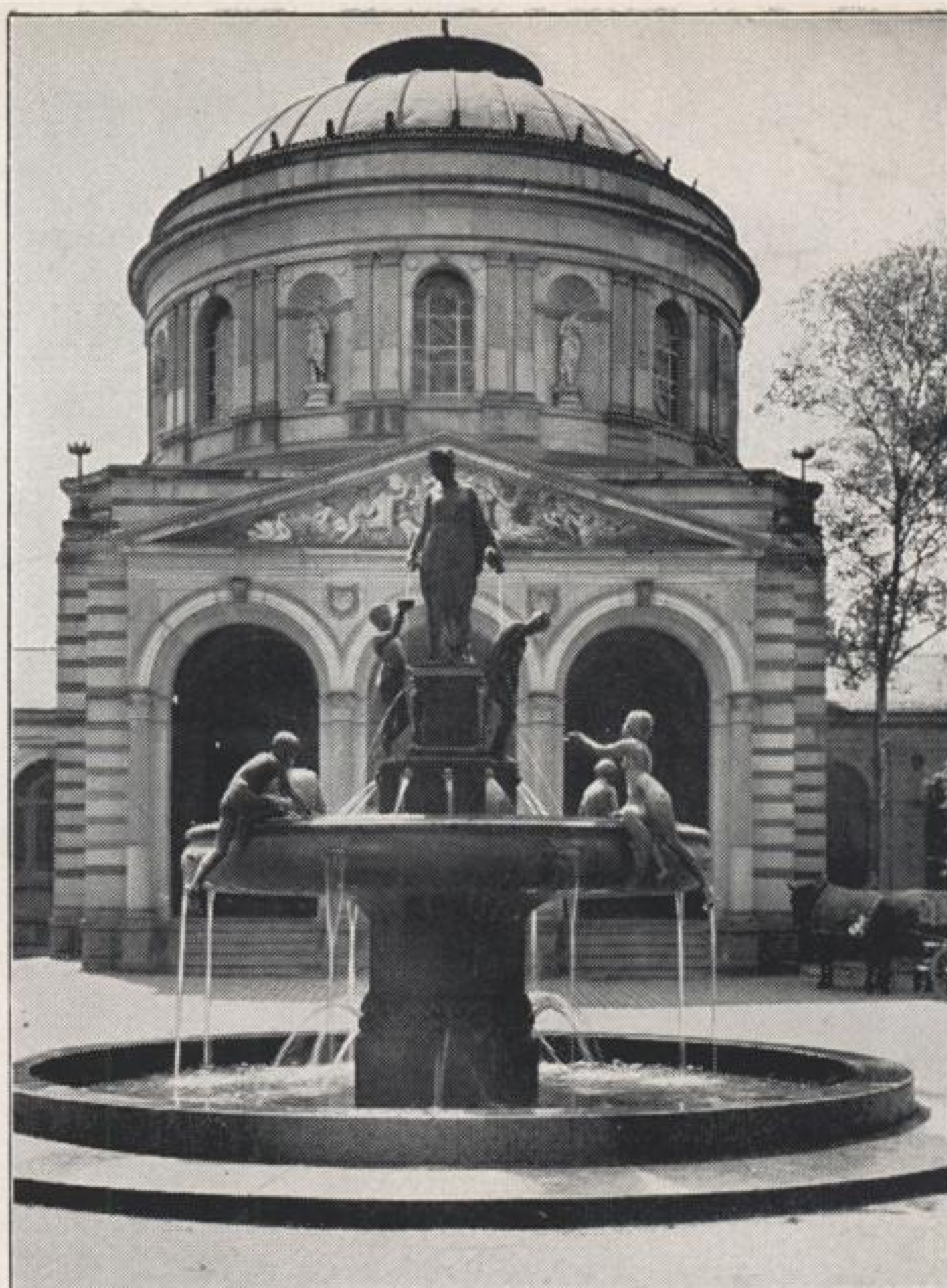
Haupteingang zum Städt. Vierordtbad mit Hygieiabrunnen.

34 Kabinen I. Klasse und 13 Kabinen II. Klasse für Wannen- und medizinische Bäder.