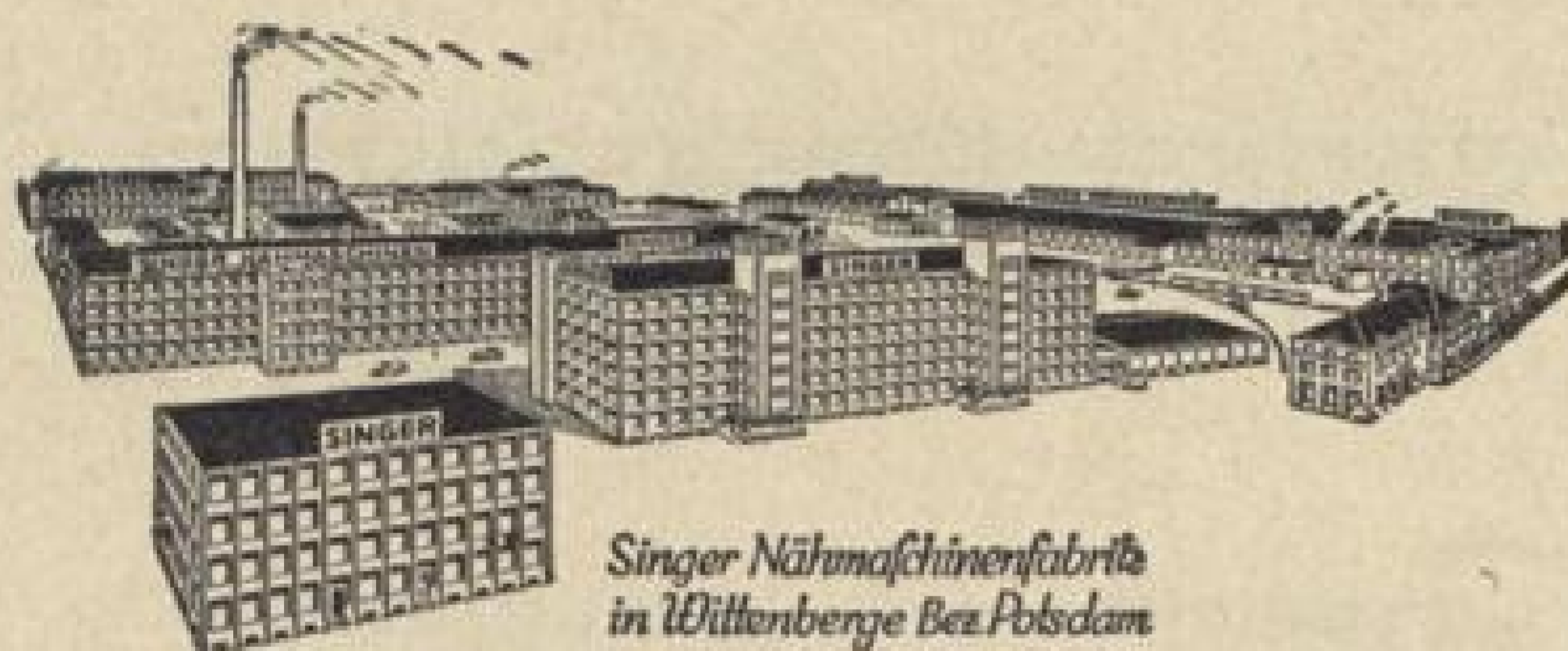
Singer Nähmaschinenfabrik in Wittenberge Bez. Potsdam

Das große Kaufhaus für Alle! Die beliebte Einkaufsstätte für das Weihnachtsfest Große Spielwarenausstellung - I. Etage Das ganze Haus im Weihnachtsschmuck