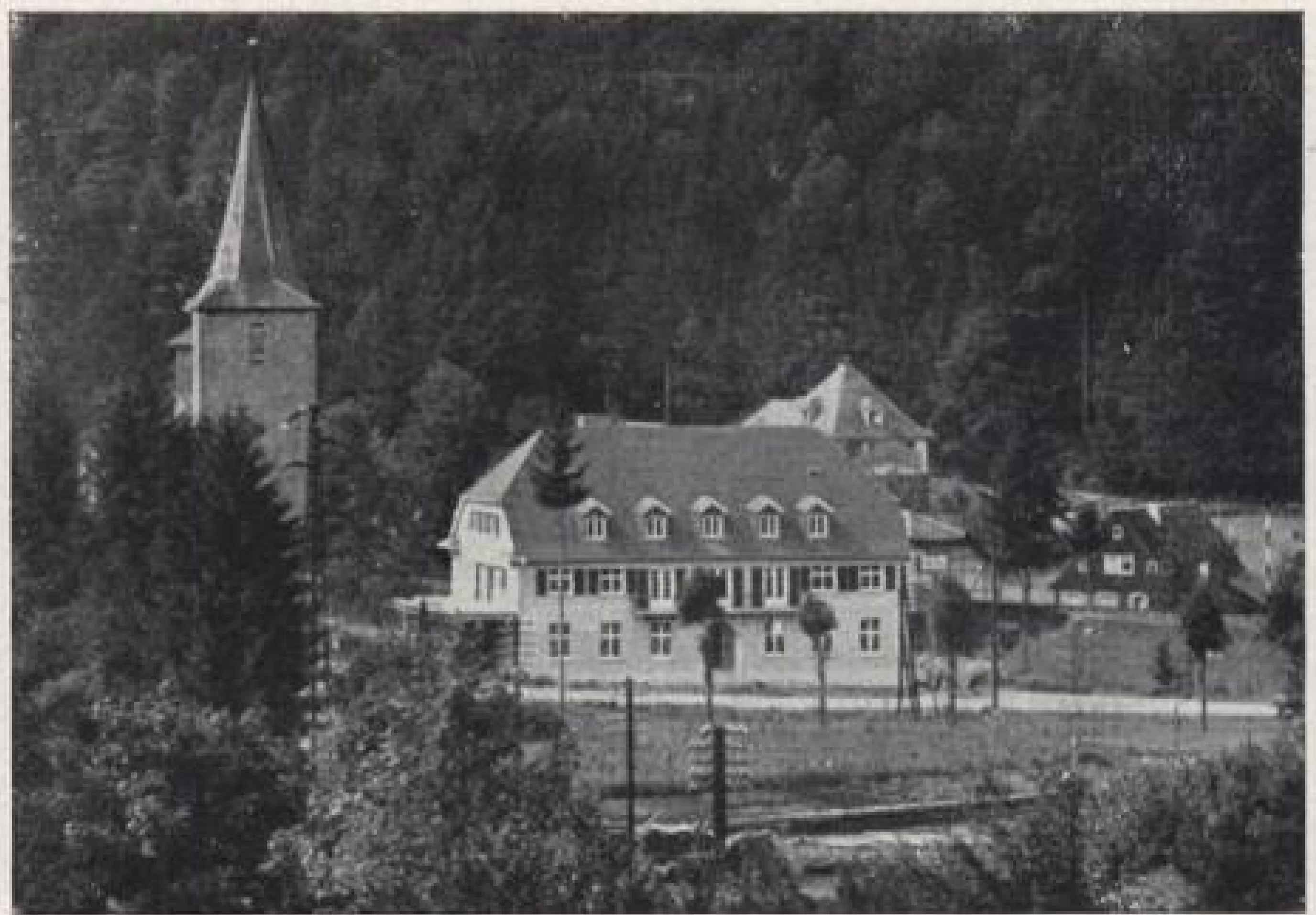
Marxzeller Mühle mit der Carl Benz- und Hans-Thoma-Stube.

Wanderungen im Albthal gehören mit zu den Herrlichkeiten in Gottes freier Natur