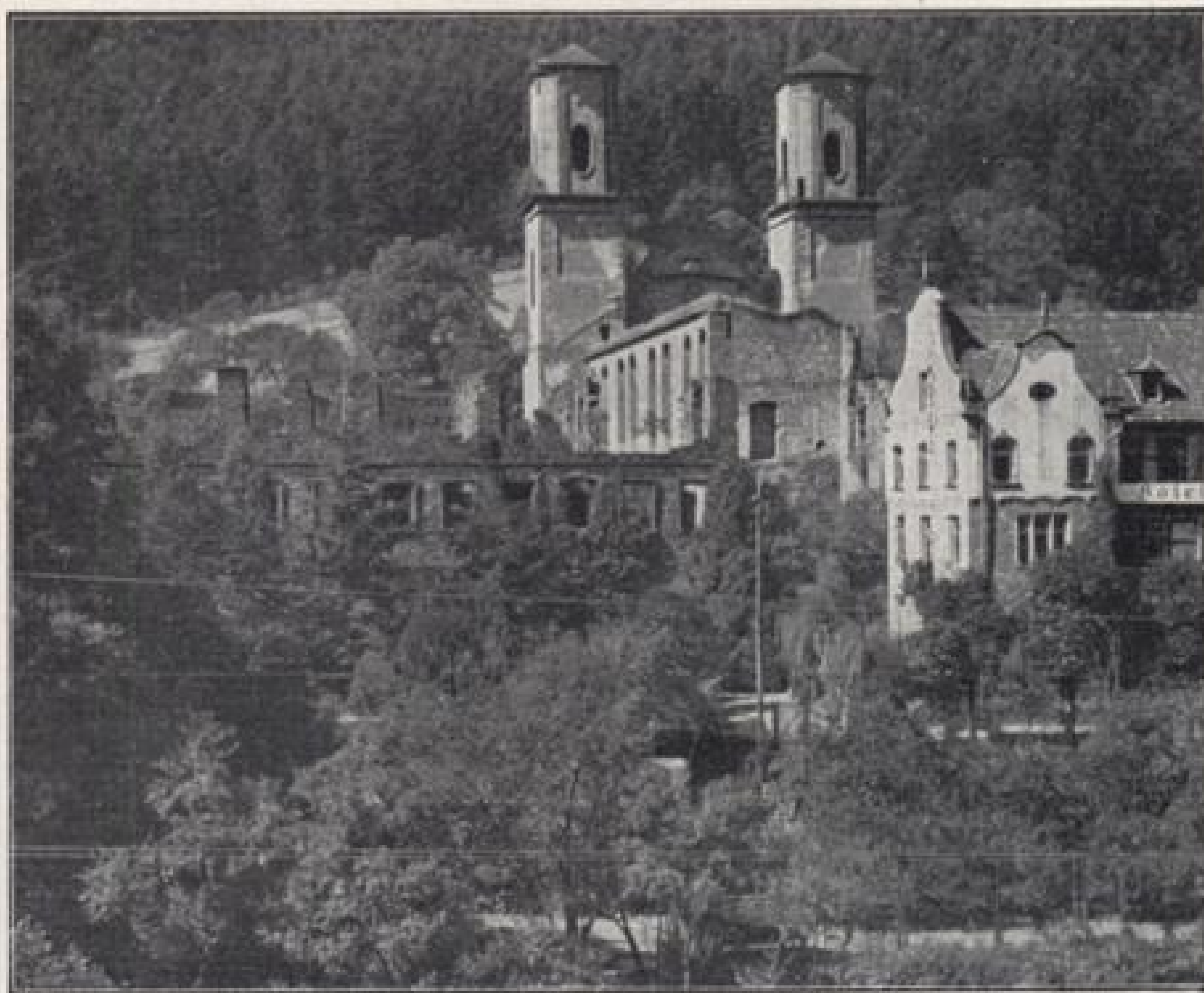
Klosterreste Frauenalb. — Die Klosterreste Frauenalb und Herrenalb und das kleine Kirchlein in Marxzell stammen aus dem 11. Jahrhundert.