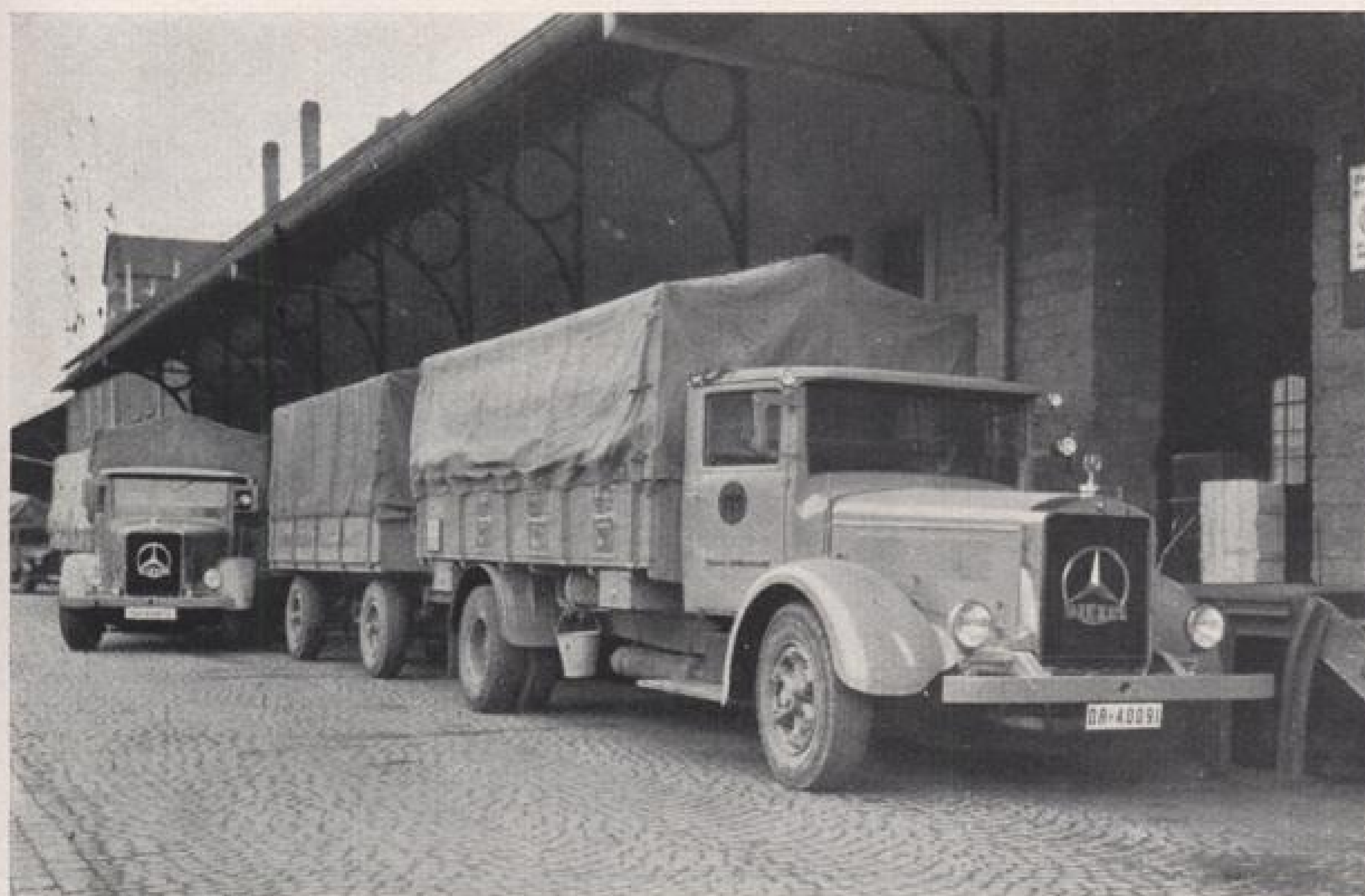
Beladung von Lastzügen für die Reichsautobahn.