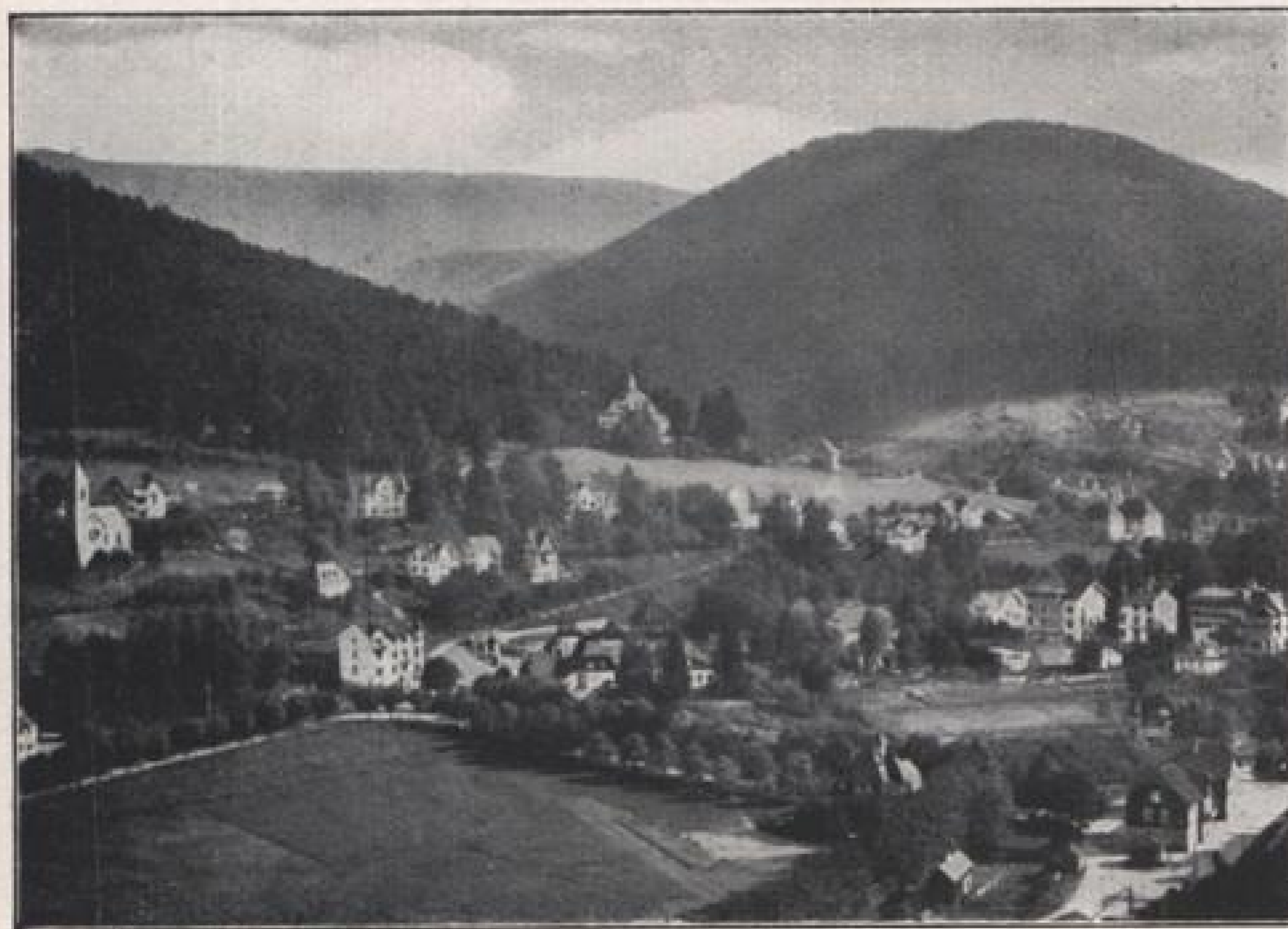
Luftkurort Herrenalb im nördl. Schwarzwald.

Das in der Nähe der badischen Gauhauptstadt Karlsruhe bei dem schön gelegenen Städtchen Ettlingen vom Rheintal abzweigende Albtal führt in leichten Windungen hinein in den nördlichen Schwarzwald, vorbei an der altehrwürdigen Kloster- ruine Frauenalb nach dem Luftkurort Herrenalb, der wegen seiner anmutigen Lage zu den be- liebtesten Sommerfrischen und Ausflugspunkten zählt. In einer Höhe von 4—500 m ü. d. M. ge- legen, genießt dieser Luftkurort einen natürlichen Schutz durch die ihn umgebenden walddreichen Berge und eignet sich deshalb vorzüglich für Sommer- und Winterkuren. Wanderfrohe Menschen finden an ihm einen Ausgangs- und Stützpunkt für schattige Halbtags- und Tageswanderungen in die umliegenden ausgedehnten Laub- und Nadelwälder nach dem benachbarten Luftkurort Dobel, der hoch- gelegenen Teufelsmühle und anderen schönen Ziel- punkten. Ein gut eingerichtetes Strandbad ver- mag die Ansprüche auch verwöhnter Badefreunde zu befriedigen. Der bequeme Kurgast findet einen angenehmen Aufenthalt in dem hübsch gelegenen Kurgarten, in dem während der Sommermonate täglich eine Kerkapelle für die Unterhaltung der Besucher sorgt.