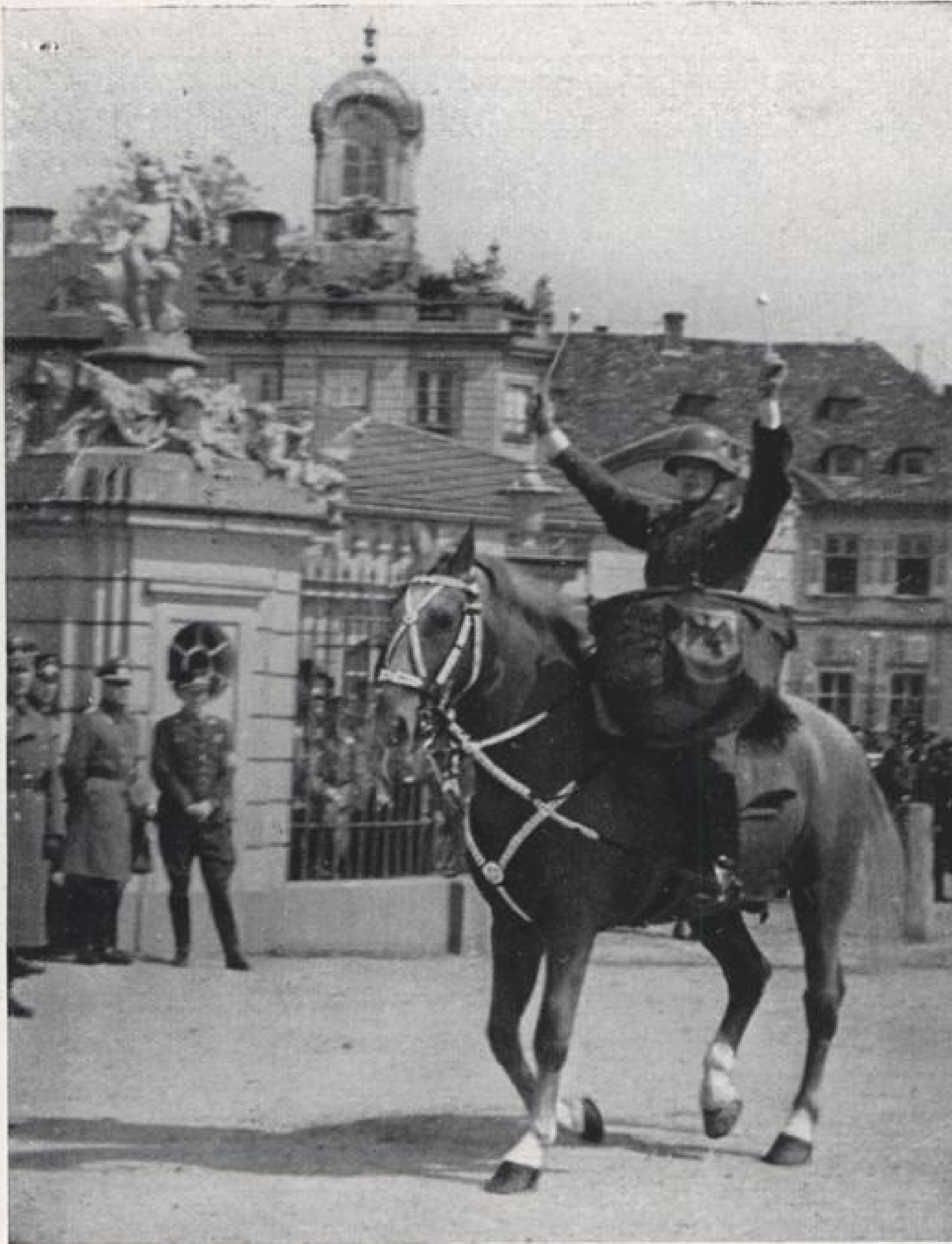
Erste Parade in der neuen Garnison.

Friedhof ehrte die Stadtverwaltung Karlsruhe die Gefallenen des Weltkrieges durch ein großes Denkmal. Das Mal für Albert Leo Schlageter im Beierthemer Wäldle und der Paul-Billet-Gedenkstein auf der Kaiserstraße reden gleichfalls die erhabene Sprache der Hingabe an das Vaterland. Ihr aller Opfertod hat sich gelohnt; das Dritte Reich wurde Wirklichkeit.