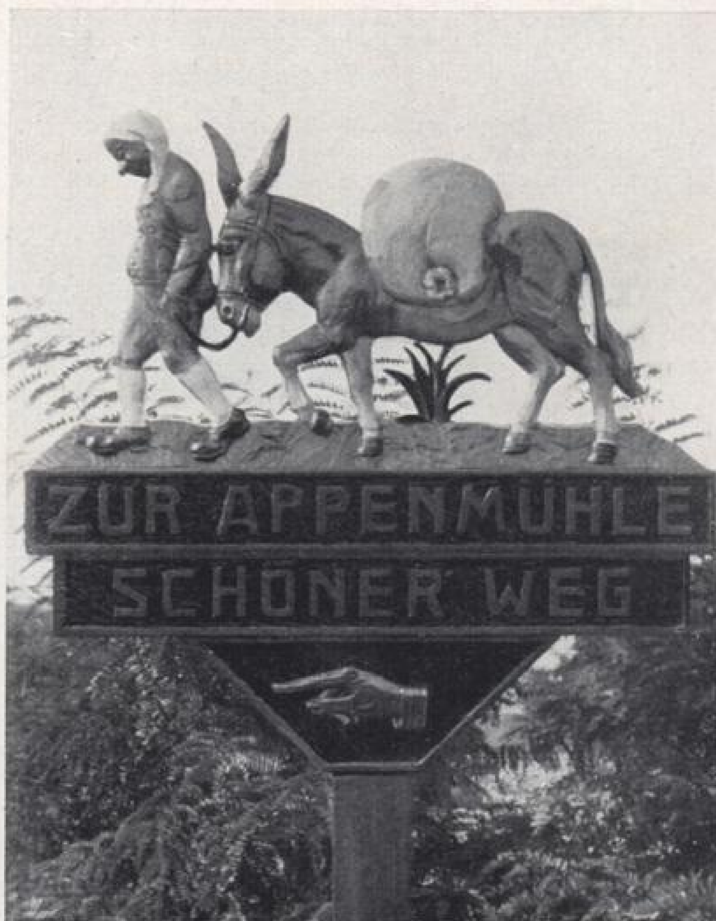
Wegweiser nach der Appenmühle.