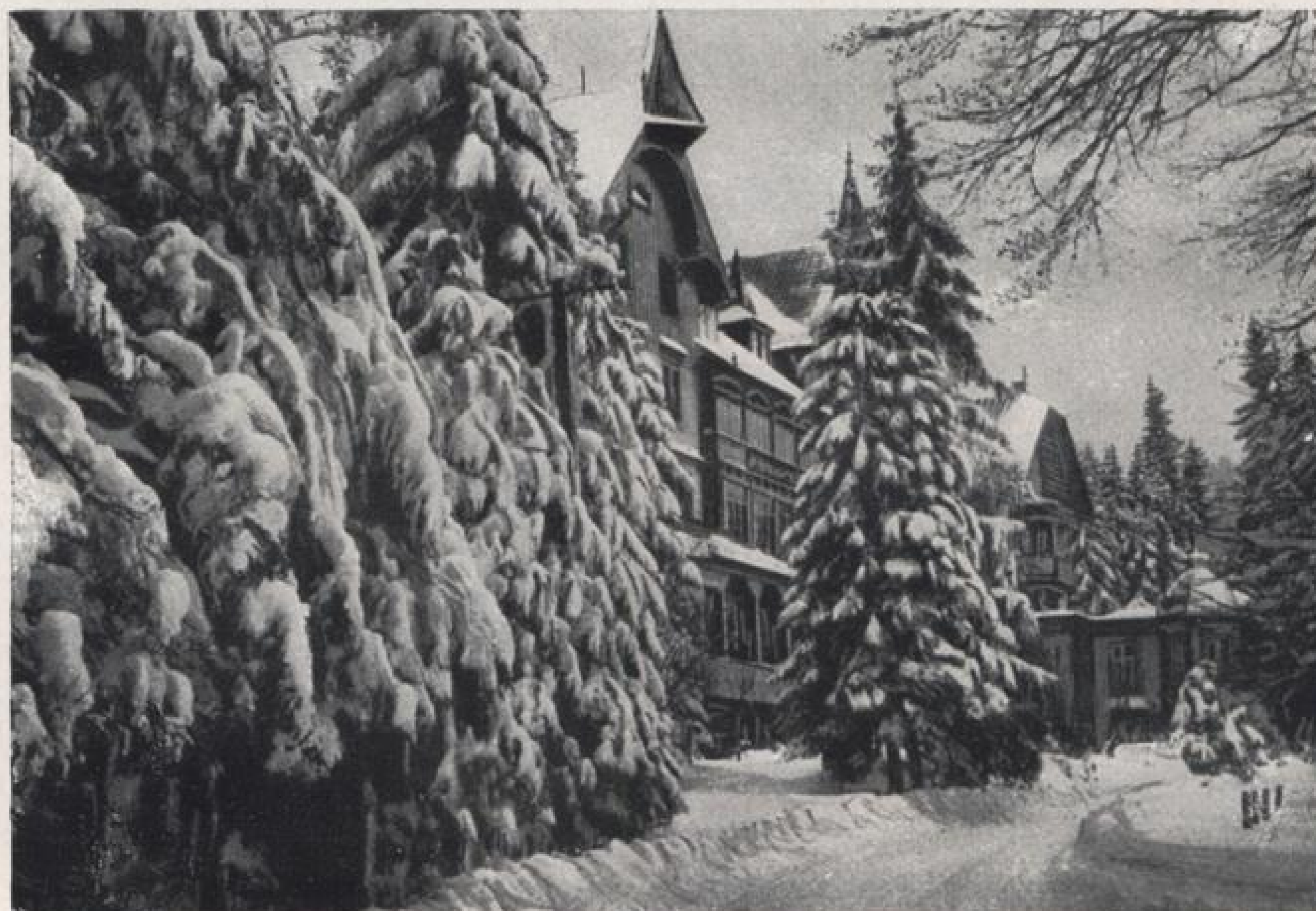
Kurhaus Sand im nördlichen Schwarzwald.

Auf der Paghöhe Bühlertal—Murgtal, an der neuen Schwarzwald-Autohochstraße, liegt in ca. 30 Automobil-Minuten von Bühl oder von Baden-Baden der „Sand“, wie er allgemein genannt wird. Das Kurhaus Sand entspricht den weitgehendsten Ansprüchen der Neuzeit. In herrlicher, zentraler Lage, umgeben von großen Hochwaldungen, mit entzückenden Waldspaziergängen nach allen Richtungen, und als Knotenpunkt von vier Hauptverkehrsstraßen, ist der Sand besonders ein Stützpunkt für den Wintersport und große Skitouren; er liegt im Herzen des Schneegebietes des nördlichen Hochschwarzwaldes und hat eine große Ski-Übungs-