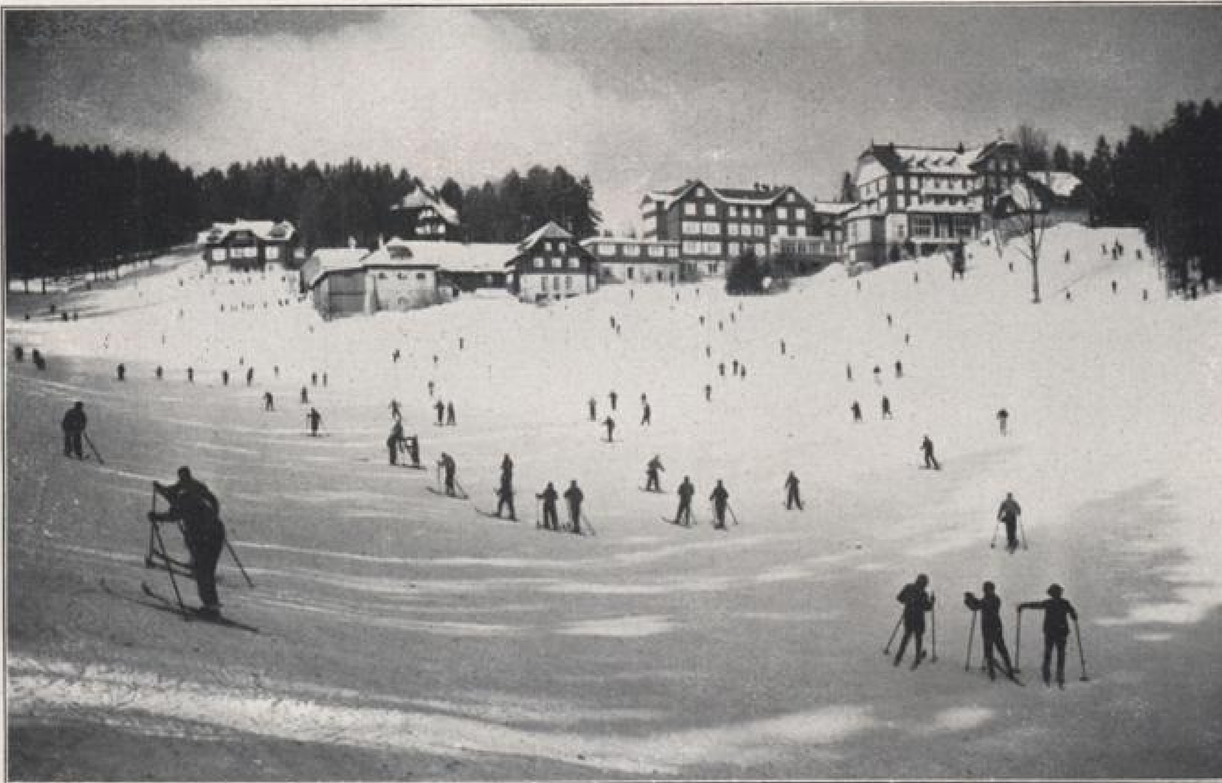
Das Kurhaus Hundseck zwischen der Hornisgrinde und Badener Höhe.

Neuzeitlich-bequeme Omnibusse der Reichspost unterhalten Sommer und Winter mehrmals täglich regelmäßige Verbindungen mit Bühl und Baden-Baden, so daß auch die Benützung der Kureinrichtungen Baden-Baden, der Besuch seiner Theater, Konzerte und der neuen Spiel-