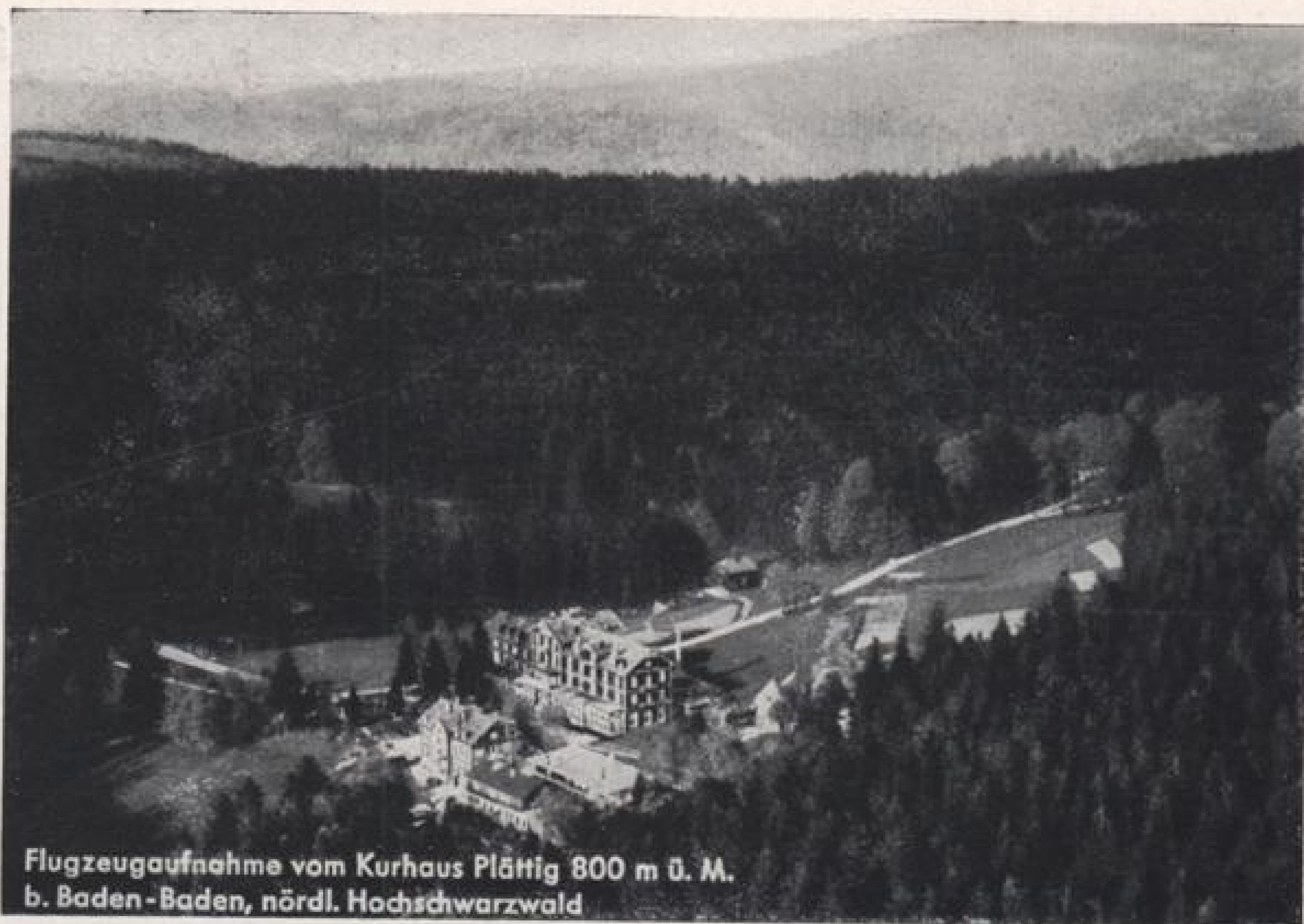
Flugzeugaufnahme vom Kurhaus Plättig 800 m ü. M. b. Baden-Baden, nördl. Hochschwarzwald