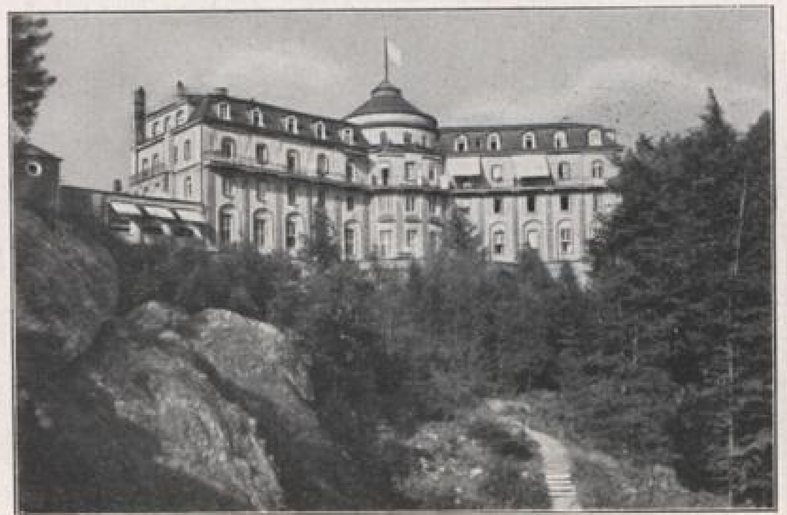
Das Kurhaus Bühlerhöhe

Die diagnostischen und therapeutischen Einrichtungen entsprechen dem heutigen Stand der Wissenschaft, insbesondere: Diätküchen, Stoffwechsellaboratorien, Röntgeninstitut, physikalische Heilmittel: Wasserkuranstalten, Luft- und Sonnenbäder, Massage und Gymnastik. Ärztliche Versorgung: für die verschiedenen Krankheitsgebiete vier Fachärzte. Auskunft und ausführliche Prospekte durch die Direktion der Kurhaus-Sanatorium Bühlerhöhe G.m.b.H., Bühlerhöhe i. Schwarzwald. Tel.: Bühl in Baden 751. Tel. Baden-Baden 1779.