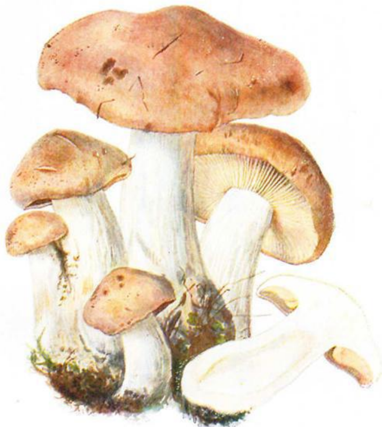
Weilchen-Ritterling. Essbar Tricholóma irinum Fr. ( Ag. cyclóphilus Lasch) (siehe hierzu Artikel im vorliegenden Heft)

Aus „Michaels Führer für Pilzfreunde“, vollständig neu bearbeitet von Roman Schulz, Berlin Ausgabe E in etwa 10 Lieferungen mit 386 Pilzgruppen in natürlichen Farben und Größen und umfanglichem beschreibenden und allgemeinen Text. Verlag Förster & Worries, Zwickau i. Sa.