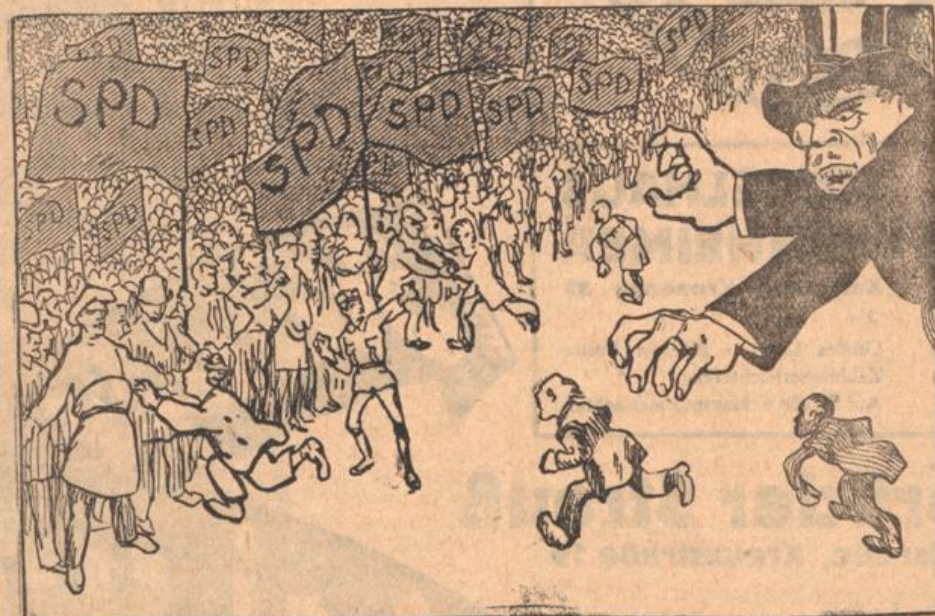
Bereinzelt seid Ihr nichts, vereint alles!