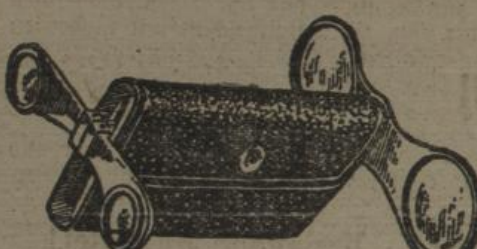
Diese Abbildung stellt Apollo fertig als Opernglas, Feldstecher und Doppel-Fernstecher dar.