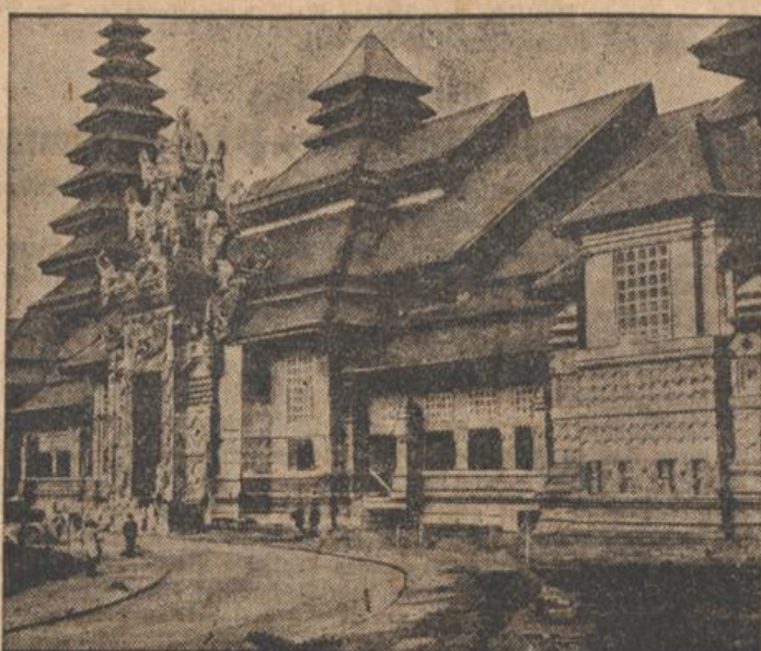
Der holländische Pavillon der Pariser Kolonialausstellung, der mit seinen unersticklichen Schönen ein Raub der Flammen wurde