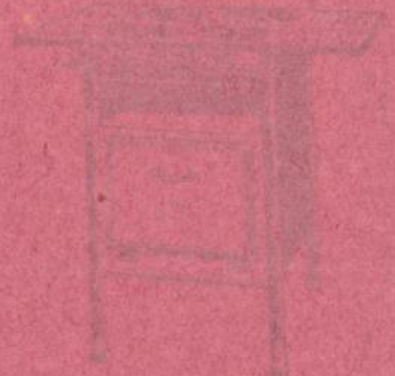
Das Bild zeigt ein Modell eines Jedermanns mit einem emaillierten Metallblech und vier Füßen.

Das Jedermann ist ein sehr praktisches und leicht zu handhabendes Küchengerät, das für die Zubereitung von Suppen, Brühen und anderen Flüssigkeiten geeignet ist. Es besteht aus einem emaillierten Metallblech, das auf vier Füßen ruht und einen abnehmbaren Deckel hat. Die Größe des Jedermanns variiert von 10 bis 20 Litern Fassungsvermögen.