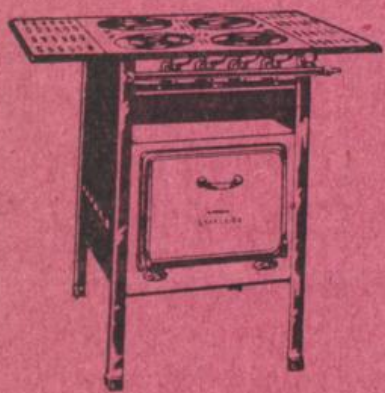
„Excelsior“-Gasherde 4 Kochstellen, Back- und Grillöfen mit Abstellplatten

Jedermann ist die Anschaffung bei angenehmen Teilzahlungs-Bedingungen des Städt. Gaswerkes von Gasapparaten möglich