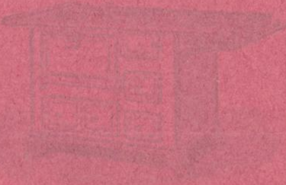
Das Bild zeigt ein Modell eines Koch-Vorriepfs mit einem emaillierten Metallblech und vier Füßen.