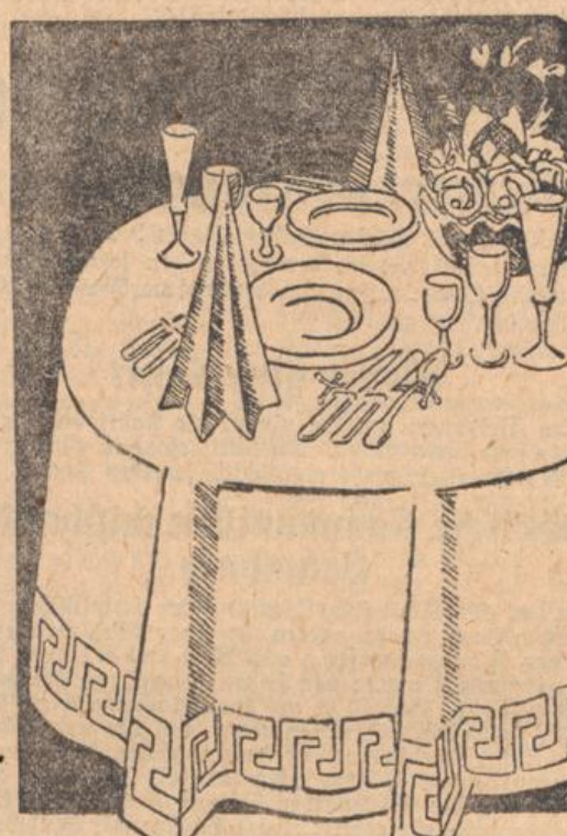
Große Ausstellung im I. Stock: „Das symbolische Tisch“.

1 Posten Kaffeelöffel, Alpaca versilbert 90 u. 100 Gr. St. 0.95 1 Posten EBHittel oder Gabeln 100 gr . . . . . Stück 1.95