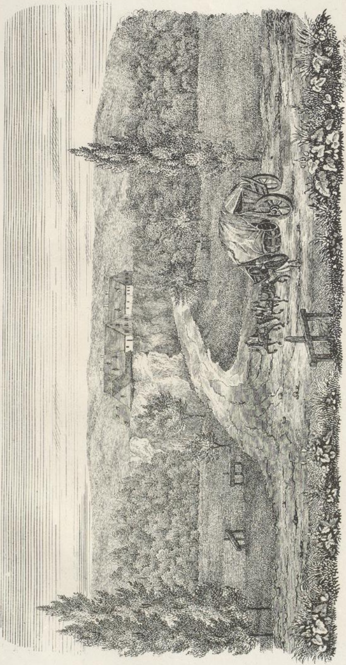
THE POLDEN THORPE.