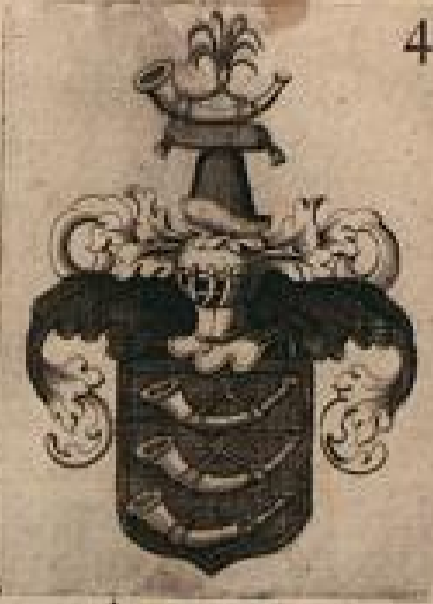
Gelschhaus zu der Jungenabend.

HENRICH zum Jungen, der alten Sage nach / aus Ungarn entsprossen / wurde von Kaiser Friedrich I. nachdem er im Krieg gegen die Markländer erspriessliche Dienste gethan / zu Verona in Italien mit dem Adelichen Stand und Freiheiten begabet 1173. Star.