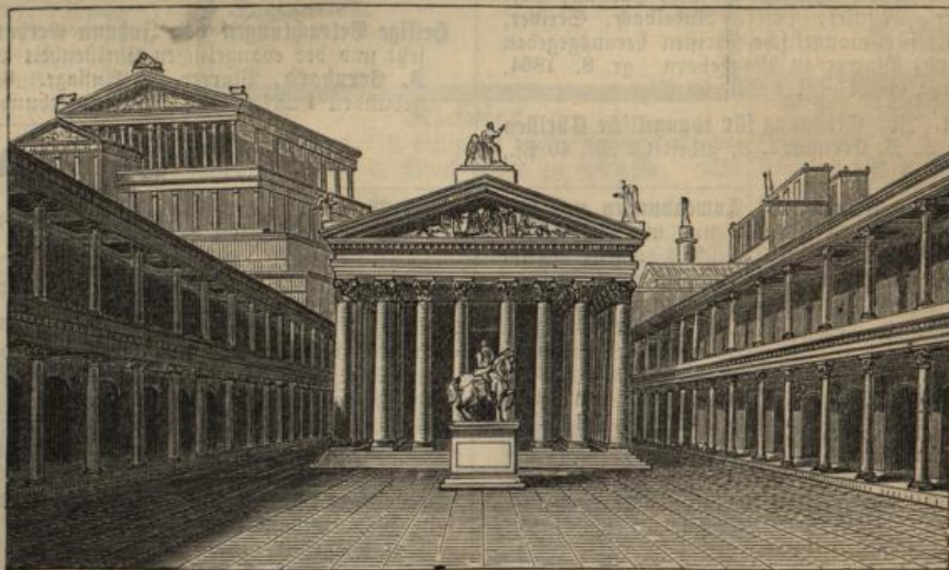
Forum des Julius Cäsar zu Rom.