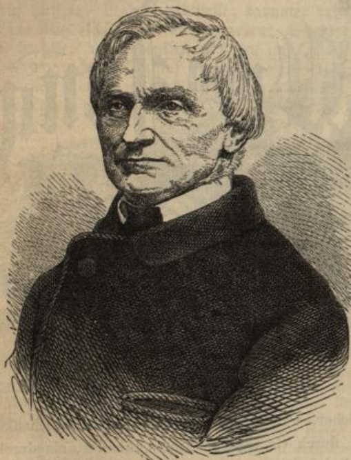
König Johann von Sachsen. Geb. 12. December 1801, gest. 29. October 1873.

von PHILALETHES (König Johann von Sachsen).