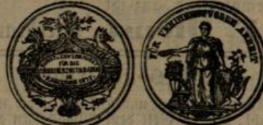
Goldene Medaille Nr. 1.