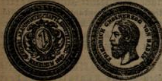
Gold-Diplom mit Nr. 1.