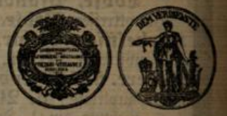
Goldene Medaille I.