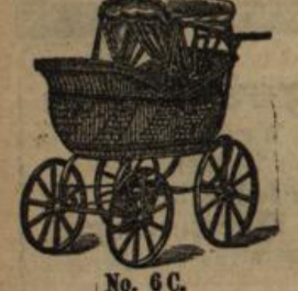
No. 6 C.

empfehle in größter Auswahl zu sehr billigen Preisen