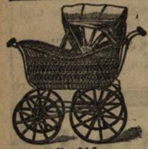
No. 34 C.

3.2. Kronenstrasse 7, nächst dem Zirkel.