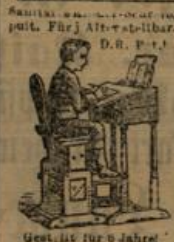
Geistl. Eig. für 6 Jahre.

empfehle sein Lager von Polstermöbeln aller Art als passende Weihnachtsgeschenke . Reparaturen werden bestens besorgt.