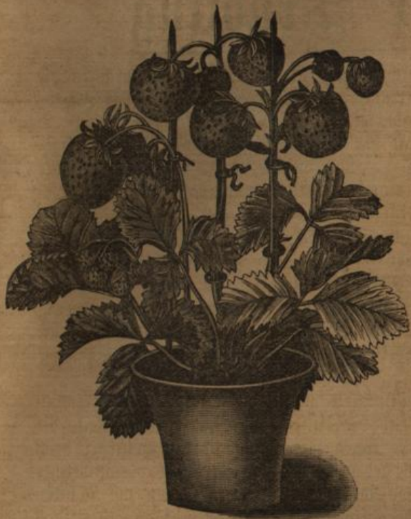
Erdbeertopf aus dem Treibbeete.