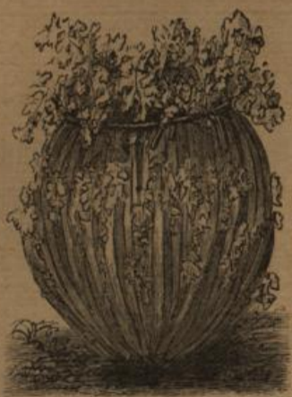
Zum Bleichen gebundene Endivie.