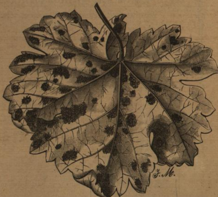
Mit Gallen besetztes Weinblatt.