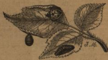
Marienkäferchen mit Larve und Puppe.