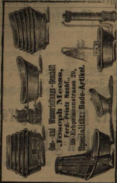
Wasch- und Wasserleitungs-Geschäft Joseph Meess, Ferd. Prinz Nachf., 29 Erbprinzenstrasse 29, Spezialität: Bade-Artikel.

Erbprinzenstraße 30 (Ludwigsplatz), empfiehlt sein Lager in Herren-, Damen- und Kinderstiefeln zu den billigsten Preisen. Bestellungen nach Maaz sowie Re- paraturen schnell und billig.