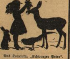
Aus Knecht's „Schwarzer Peter“.

Der kleine Dämmerling berichtet im Schlaraffenland vermöge seiner Klugheit die reichhaltigsten Thaten, erzählt die wunderbaren Schicksale und gelangt am seiner Jugendzeit willen zu hohen Ehren, an denen er als braver Sohn seine armen Eltern teilnehmen läßt. Alles ergötzlich erzählt und schön durch Bilder verdeutlicht.