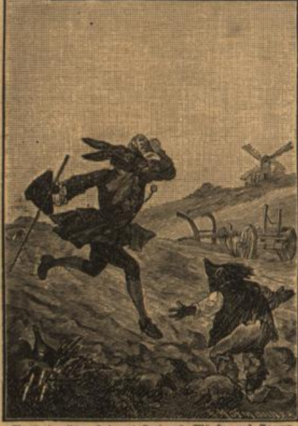
Wettlauf zwischen Hase und Igel aus 'Märchen und Sagen'.

Märchen und Sagen. Festgeschenk für die Jugend. Ausgewählt und bearbeitet von C. Osterdinger und 378 Seiten. gr. 8. Mit 8 prächtigen Farbendrucken von G. G. Hoffmann. Mit 8 prächtigen Farbendrucken von G. G. Hoffmann. Das schönste Märchenbuch für die Jugend, das bisher in Deutschland erschienen. Preis 7.50. Im gesamten Buchhandel ist uns noch kein so prächtiges Märchenbuch begegnet. St. Galler Bl.