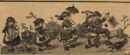
Aus „Unzerreißbares Bilderbuch“.

ABC- und Bildertafeln für kleine Kinder. 100 farbige Abbildungen auf 16 Tafeln. Mit vielen Geschichten, Reimen, Sprüchen von E. Burger, Guido Hammer, Ernst Hartmann, J. Neumann, C. Osterdinger, Oscar W. etc. Auf starke Pappdecken gezeugt und unzerreißbar gebunden liefert das Bilderbuch den zerbrechlichen Händen der Kleinen energiegelichen Widerstand. 49. 5. Aufl. M. 4.50