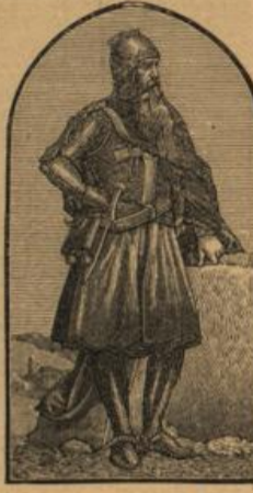
Charothesa aus 'Deutsche Kaiser'.

Die deutschen Kaiser. 88 prächtige Farbendrücke auf 29 Tafeln mit geschichtlichen Text. In Reime gebracht von M. Barak. M. 6. Die in feinem Farbendruck ausgeführten Bildnisse der deutschen Kaiser von Karl dem Großen bis Wilhelm I. Der gereimte, gut gewählte Text, die Regierungsjahre jedes Kaisers in kurzen charakteristischen Zügen schildernd, prägen sich dauernd und leicht dem Gedächtnis ein. Das feillich angeordnete Buch ist für die etwas vorgeschrittene Jugend ein treffliches Mittel, das Interesse für die deutsche Geschichte zu wecken und zu kräftigen. Jugendschriften-Kommission des Schweiz. Lehrervereins.