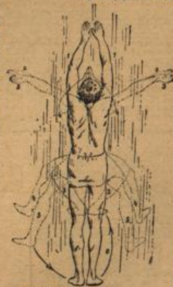
Bewegungen beim Schwimmen.

das vielseitigste und anregendste Buch für Knaben, ein unzertrennlicher Kamerad fürs ganze Jahr.