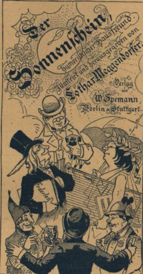
Preis eleg. gebunden M. 6.60.