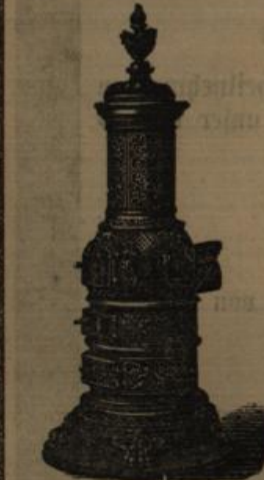
Viele Prämierungen und Auszeichnungen.

≡ Beste Garantie für Solidität, angegebenen Kohlenverbrauch u. Heizeffekt. ≡