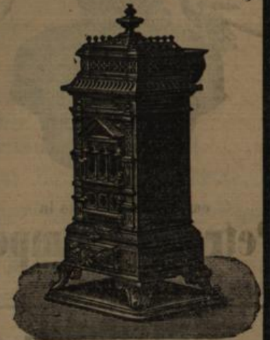
Beste Referenzen und Zeugnisse zur Verfügung.