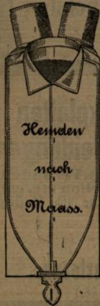
Vorrätige Herren-Hemden à Mk. 2,50, Mk. 3,50, Mk. 4,50, grösste Auswahl in Herrenkragen u. Manschetten neuester Formen.

Wäsche-Fabrik, Ausstattungs-Geschäft, 171 Kaiserstrasse 171.