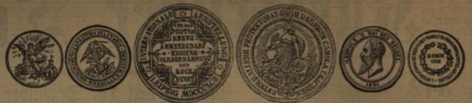
Goldene und silberne Medaillen.

Für gut erhaltene Herrenkleider, Stiefel, Betten, Möbel, sowie altes Gold und Silber zahlt den höchsten Wert Ed. Lämmle, Kronenstr. 51. 3.2.