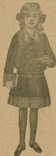
Schulkleidchen aus einem Knaben-Matrosenanzug und etwas Stoff.