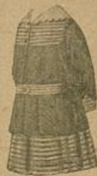
Schulkleidchen aus einem Knabenkittel und einem Stoffrest.