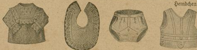
Shürchen, 2 Shürchen, Leibchen und 2 Windelhosen aus einem weißen Piqueunterrock.