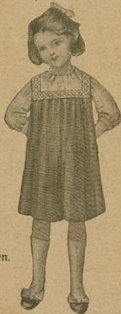
Hänger aus einem Stoffrest mit Unterziehlüschen.