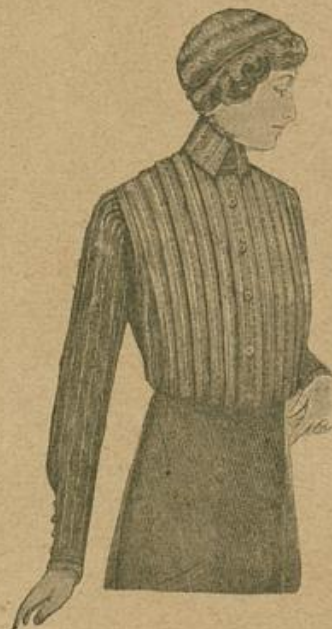
Bluse für Damen.