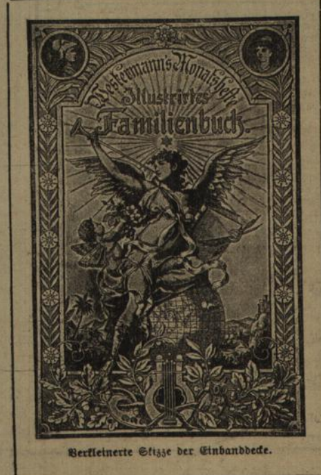
Verfeinerte Skizze der Einbandbede.