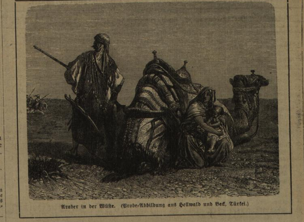
Karavanen in der Wüste. (Grobe-Abbildung aus Hellwald und Bed. Türkei.)

Kulturgeschichte des neunzehnten Jahrhunderts in ihren Beziehungen zu der Entwicklung der Naturwissenschaften geschildert von Ernst Haller, Professor in München. Mit 180 Abbildungen. Stuttgart. (847 Seiten.) Eleg. Leinenband. Statt des Ladenpreises von M. 22.50 für nur M. 7.—