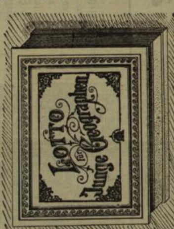
Ein unterhaltendes Gesellschaftsspiel.