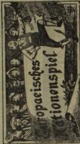
Ein lustiges Spiel- und Geispielspiel mit Grundtafel.