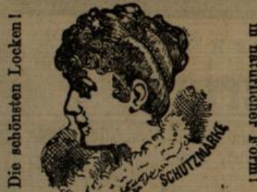
Die schönsten Locken!